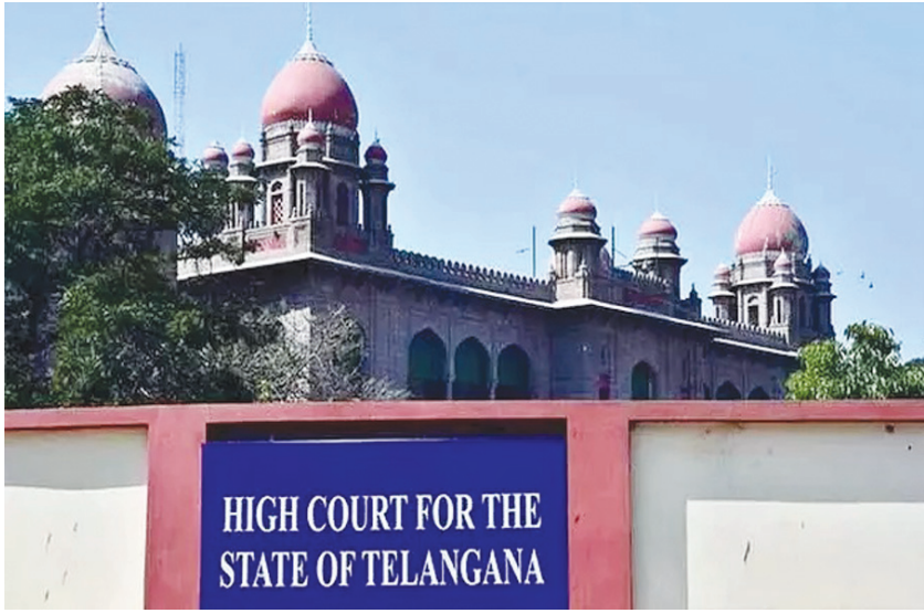
హైదరాబాద్ పెన్ పవర్:కొందరు తెలంగాణ హైకోర్టు ప్రధాన న్యాయమూర్తి అధికారులు నిజమైన అంధులని జస్టిస్ నగేశ్ భీమపాక ఆగ్రహం వ్యక్తం

చేశారు. తెలంగాణ దివ్యాంగుల శాఖ అధికారుల తీరుపై ఆయన తీవ్ర అసహనం వ్యక్తం చేశారు. అంధులను కోర్టుల చుట్టూ తిప్పడంపై మండిపడ్డారు. కొందరు అధికారుల తీరు వల్ల అంధుల ఉద్యోగ జీవితం మసకబారుతోందని అన్నారు. తమను అన్యాయంగా ఉద్యోగం నుంచి తొలగించారంటూ కొందరు అంధులు హైకోర్టును ఆశ్రయించారు. వేర్వేరు కారణాలతో తొలగించడంపై ఎనిమిదేళ్లుగా వారు న్యాయపోరాటం చేస్తున్నారు. వారంతా కోర్టుల చుట్టూ తిరగడానికి కారణమైన అధికారులపై విచారణ సందర్భంగా న్యాయస్థానం ఆగ్రహం వ్యక్తం చేసింది.