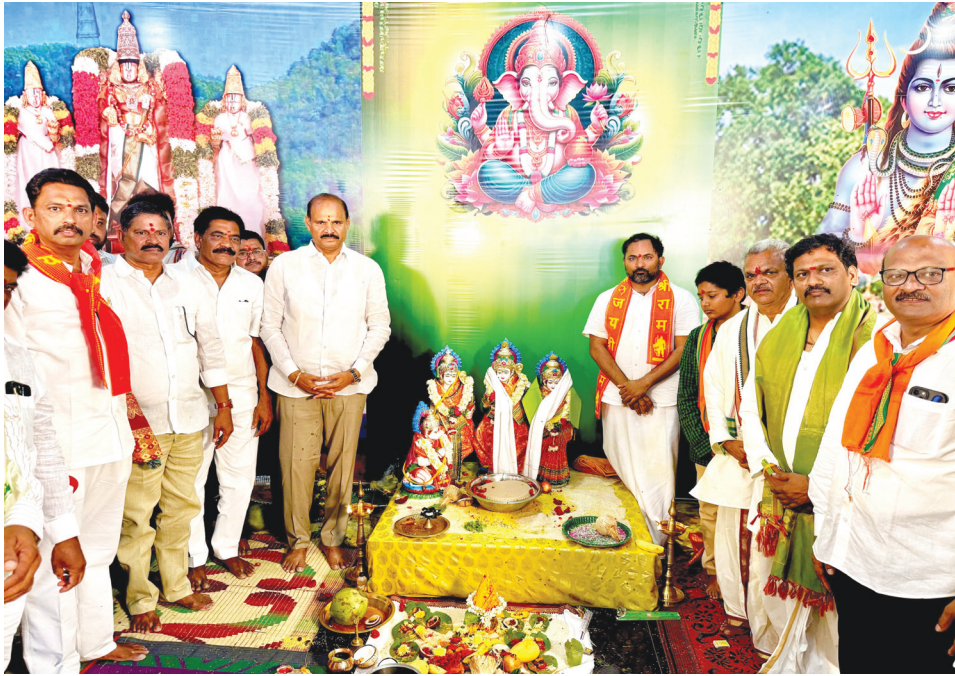
సూరారం శ్రీరామ్ నగర్ లో సీతారాముల కళ్యాణం..