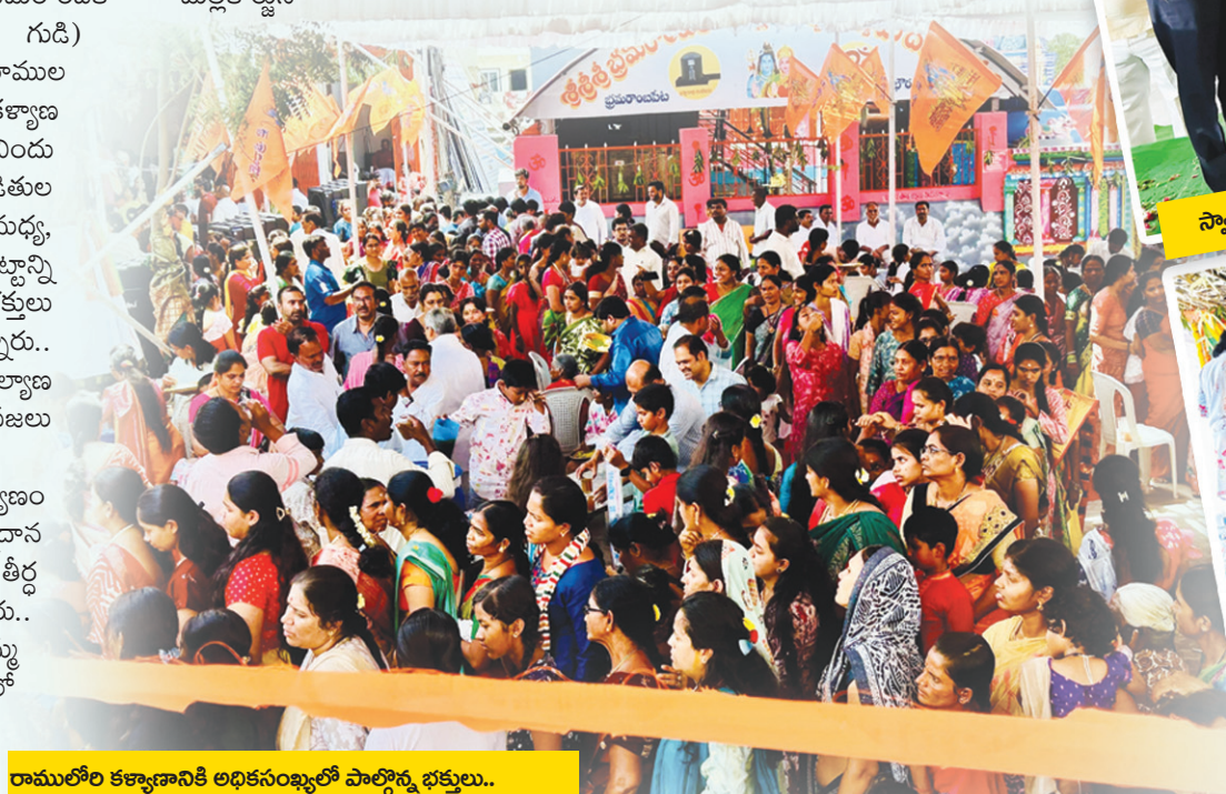
రాములీల కళ్యాణానికి అధికసంఖ్యలో పాల్గొన్న భక్తులు..