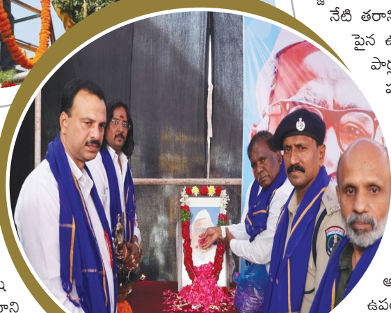
బాబూజీ చిత్రపటానికి పూలమాలలు వేసి నివాళులు అర్పించిన, అడిషనల్ కలెక్టర్, ఆర్టీవో, ఏసిపి..