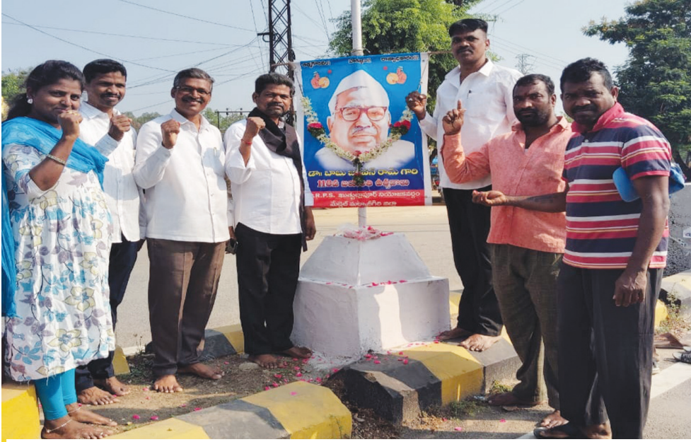
కుత్బుల్లాపూర్ మున్సిపల్ సర్కిల్లో బాబు జగజీవన్ రామ్ జయంతి వేడుకలు..