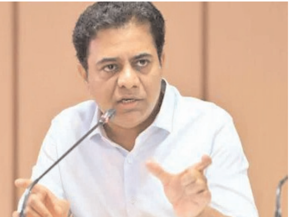
పార్టీలను నమ్మితే.. తెలంగాణ బతుకు సున్నా అని మరోసారి రుజువుచేసిన సందర్భమిది

హైదరాబాద్ ఏప్రిల్ 9 పెన్ పవర్: జీఎస్టీపీ, తలసరి వృద్ధి రేటులో తెలంగాణ అట్టడుగున నిలవడంపై బీఆర్ఎస్ వర్కింగ్ ప్రెసిడెంట్ కేటీఆర్ తీవ్ర ఆగ్రహం వ్యక్తం చేశారు. కేసీఆర్ వేసిన ఆర్థిక పునాదులను కాంగ్రెస్ సర్కార్ ధ్వంసం చేస్తోందని కేటీఆర్ మండిపడ్డారు. జీఎస్టీ వృద్ధిరేటు గుండు సున్నాగా నమోదు కావడంతో ఆయన ధ్వజమెత్తారు.సన్నాసి ఢిల్లీ