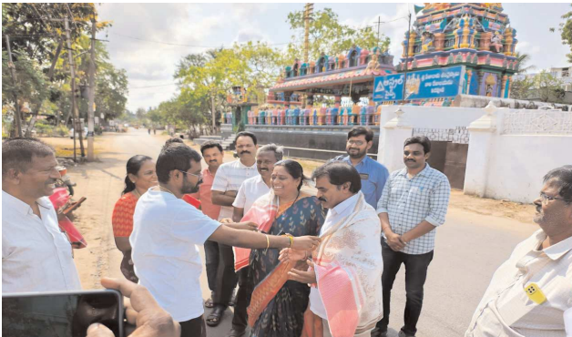
గూడపాడు, పెద్దపూడి గ్రామాలలో క్షేత్రస్థాయిలో పర్యటించారు. తొలుత ఆయన గూడపాడు గ్రామంలో తడి పొడి చెత్తను వేరువేరుగా సేకరించే విధానాన్ని స్వయంగా పరిశీలించడంకోసం గ్రామంలోని చెత్త నుంచి