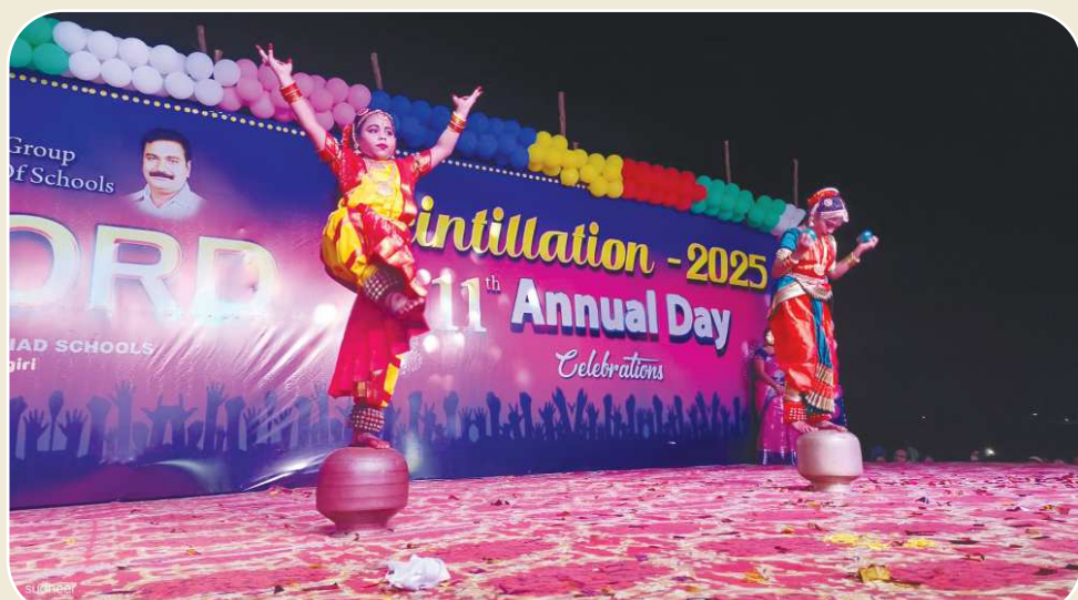
కందుకూరు పెన్ పవర్, ఏప్రిల్ 3