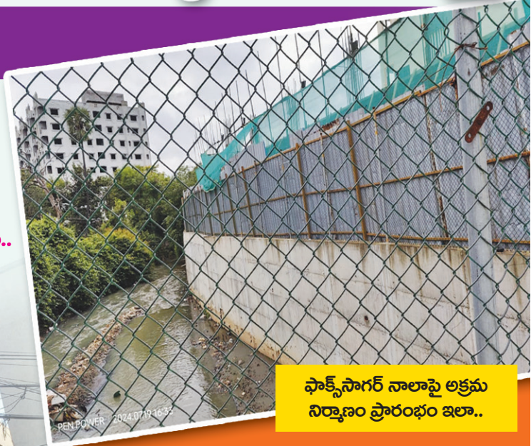
ఫాక్స్ సాగర్ నాలాపై అక్రమ నిర్మాణం ప్రారంభం ఇలా..