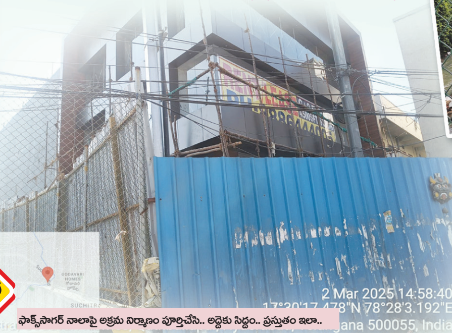
ఫాక్స్ సాగర్ నాలాపై అక్రమ నిర్మాణం పూర్తిచేసి.. అడ్డకు సిద్దం.. ప్రస్తుతం ఇలా..