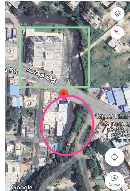
ఎడమవైపు తిరుమల హైట్స్.. కుడివైపు ప్రస్తుత అక్రమ నిర్మాణం.. గూగుల్ మ్యాప్ లో..