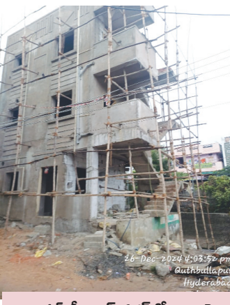
చింతల్ శ్రీనివాస్ నగర్ లో నాలాపై అక్రమ నిర్మాణాలు.