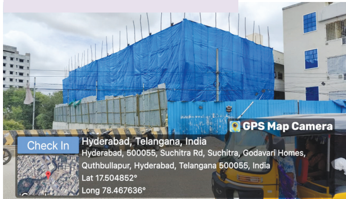
అక్రమ నిర్మాణం నిర్మాణ దశలోని ఫోటో..

ఫాక్స్ సాగర్ నాలాపై అక్రమ కట్టడానికి ఇప్పటికైనా సహకరించిన, నీటిపారుదల టౌన్ ప్లానింగ్ అధికారులపై..! నాలా స్థలంలో అక్రమ కట్టడానికి అనుమతులు రద్దు చేసినా..! 2024 ఆగస్టు 16న సీజ్ చేసిన బిల్డింగ్ ను, సీల్ తొలగించిన అక్రమ నిర్మాణ దారుడిపై తక్షణమే క్రిమినల్ కేసు నమోదు చేయాలని డిప్యూటీ కమిషనర్ నరసింహుని సతీష్ డిమాండ్ చేశారు.. ప్రజలను ముంపుకు గురిచేస్తున్న బాధ్యత లేని అధికారులను సస్పెండ్ చేయాలని ఆకుల సతీష్ కోరారు..