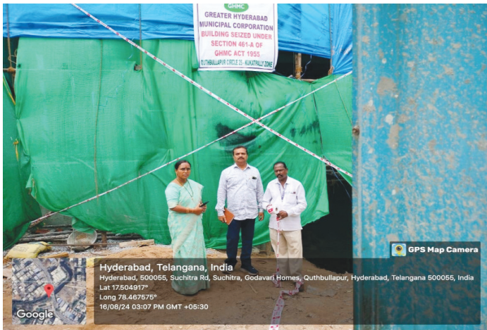
2024 ఆగస్టు 16న కుత్బుల్లాపూర్ సర్కిల్-25 టౌన్ ప్లానింగ్ సీజ్.. ఫైల్ ఫోటో..