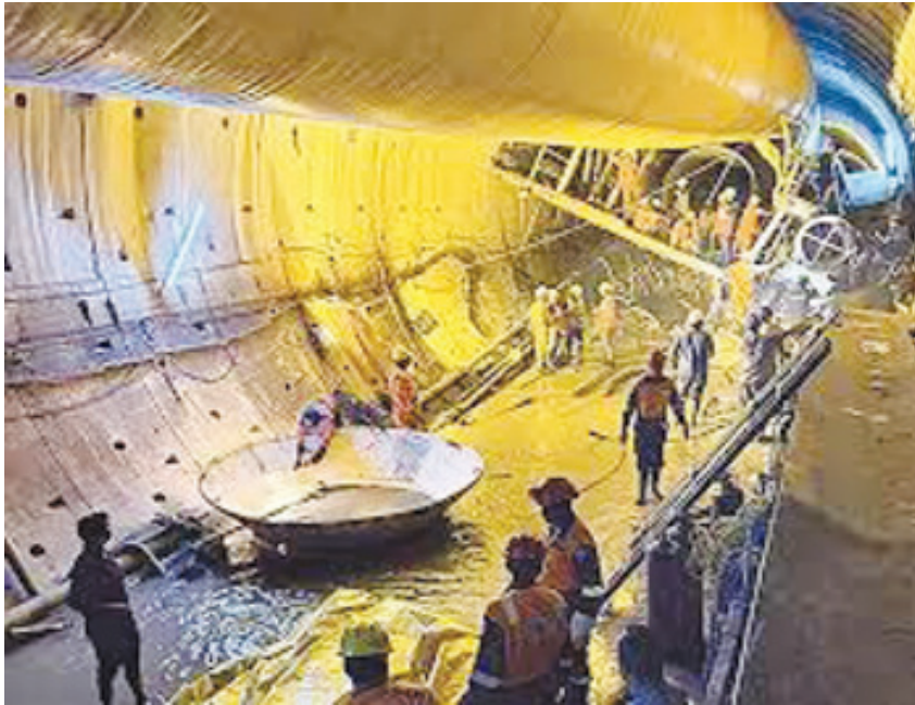
కాగా, సహాయక బృందాలు పిప్పకు 120 మంది పరిస్థితిని ఎప్పటికప్పుడు పర్యవేక్షిస్తున్నాయి. చొప్పున 3 పిప్పల్లో పనిచేస్తున్నాయి. ఎన్టీఆర్ఎఫ్, సహాయక చర్యల్లో మొత్తం 18 ఏజెన్సీలు, 700 ఎన్టీఆర్ఎఫ్, హైద్రా, సింగరేణి బృందాలు మంది సిబ్బంది పనిచేస్తున్నారు.

హైదరాబాద్ పెన్ పవర్:ఎస్ఎల్పీసీ టన్నెల్ వద్ద ఫిబ్రవరి 22న జరిగిన ప్రమాదంలో ఎనిమిది మంది గల్లంతవడం తెలిసింది. వారు బతికుండా అవకాశాలు పూర్తిగా అడుగంటిపోయాయి. మృతదేహాల వెలికితీతకు సహాయక చర్యలు కొనసాగించాల్సిన పరిస్థితి ఏర్పడింది. ఇవాళ 9వ రోజు కూడా సహాయక చర్యలు కొనసాగుతున్నాయి. ఎన్టీఆర్ఎఫ్, ఎస్టీఆర్ఎఫ్, ఆర్మీ, నేవీ, ర్యాట్ హెల్ మైన్స్, పోలీసులు, హైద్రా టీమ్, సింగరేణి బృందం, పలు ప్రైవేటు కన్ ట్రాక్టర్ కంపెనీల బృందాలు తవ్వకాలు ముమ్మరం చేశాయి. కాగా, ఇవాళ నాలుగు మృతదేహాలు వెలికితీసే అవకాశం ఉందని ప్రభుత్వ వర్గాలు అంచనా వేస్తున్నాయి. నిరంతరంగా నీటి ఊట వస్తుండడంతో తవ్వకాలకు అడ్డంకిగా మారుతోంది. పూడికను, కత్తిరించిన టన్నెల్ బోరింగ్ మెషిన్ భాగాలను బయటికి తరలించడంలో ఇబ్బందులు ఎదురవుతున్నాయి. కన్వేయర్ బెల్ట్ ఇప్పటికీ అందుబాటులోకి రాకపోవడంతో సహాయక చర్యల్లో ఆశించిన వేగం కనిపించడంలేదు!