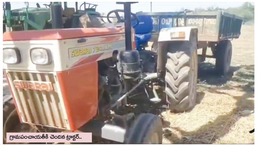
గ్రామపంచాయతీకి చెందిన ట్రాక్టర్..