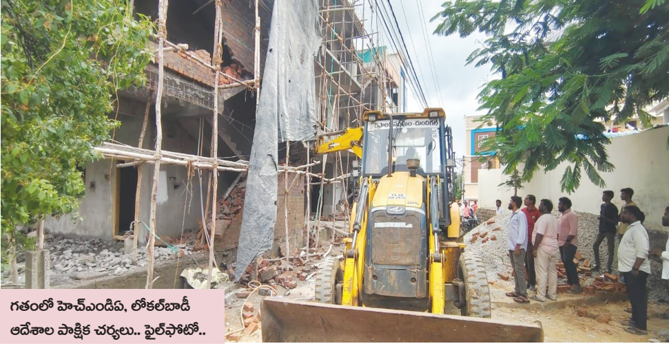
గతంలో హెచ్ఎండిపి, లోకల్ బాడీ ఆదేశాల పాక్షిక చర్యలు.. ఫైల్ ఫోటో..

అక్రమార్కులకు సహకరించడానికే.. దుండిగల్ రెవెన్యూ, మున్సిపల్ కార్యాలయాలు ఉన్నాయా అనే అనుమానాలను రేకెత్తిస్తుంది.. బహుదూర్ పల్లి సర్వే నెం.131 ప్రభుత్వ స్థలం ఆక్రమణ, మున్సిపల్ అనుమతులు లేకుండా నిర్మిస్తున్న మూడు అక్రమ కట్టడాలపై 2024 అక్టోబర్ 17న రెవెన్యూ, మున్సిపల్ కూల్చివేతలు చేపట్టారు.. అక్రమార్కులు రెవెన్యూ, మున్సిపల్ అధికారులకు ఏమేరకు ముడుపులు ముట్టచెప్పారో కానీ.. మరుసటి రోజు నుండే యధావిధిగా పనులు చేస్తున్నారు.. మంగళవారం కూడా కూల్చిన నిర్మాణాల్లో దర్జాగా పనులు చేస్తున్నారని మున్సిపల్ కమిషనర్, టిపిఎస్ కి సమాచారం చేరవేసినా చర్యలు శూన్యం.