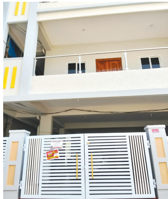
చర్యలకు లోకల్ బాడీ ఆదేశాలు ఉన్నప్పటికీ.. మున్సిపల్ అధికారుల సౌజన్యంతో పూర్తి.. తాజా ఫోటో..

రెవెన్యూ 'ఎన్ఓసీ' లేదు..! మున్సిపల్ అనుమతులు లేవు..! దుండిగల్ మండలం బహుదూర్ పల్లి సర్వే నెం. 128 పట్టాభూమితో..! సర్వే నెం. 131 ప్రభుత్వ భూమిని ఆక్రమించి నిర్మిస్తున్న..! బీఆర్ఎస్ నేతకు చెందిన మూడు అక్రమ భవన నిర్మాణాలకు.. రెవెన్యూ నుండి 'ఎన్ఓసీ' లేదు.. మున్సిపల్ అధికారుల నుండి నిర్మాణ అనుమతులు లేవు..! అయినప్పటికీ యధేచ్ఛగా పనులు చేపట్టడం అధికారుల చేతివాలానికి నిదర్శనం.. ప్రభుత్వ భూమికి, పట్టా భూమికి సరిహద్దు ఉన్నట్లయితే రెవెన్యూ ఎన్ఓసీ తప్పనిసరి..! కానీ కట్టా చేసి ఓ బీఆర్ఎస్ నాయకుడు అయినందునే సంబంధిత అధికారులు సహకరిస్తున్నారని స్థానికులు ఆరోపిస్తున్నారు.. 2024 ఫిబ్రవరి 6న హెచ్ఎండిపి, లోకల్ బాడీ ఆదేశాలతో..! గత అక్టోబర్ 17న రెవెన్యూ, మున్సిపల్ సంయుక్తంగా కూల్చివేశారు.. అయినప్పటికీ మళ్ళీ యధావిధిగా పనులు కొనసాగించి రంగులు వేశారు.. సంబంధిత అధికారుల దృష్టికి తీసుకెళ్ళినా మామూళ్ళు మత్తులో చర్యలకు దూరంగా ఉంటున్నారని స్థానికులు ఆరోపిస్తున్నారు.. కూల్చివేసిన బీఆర్ఎస్ నేతల అక్రమ కట్టడాలు మళ్ళీ ఎందుకు నిర్మించారో, ఏ అధికారుల ప్రమేయం ఉందో "హెచ్ఎండిపి-లోకల్ బాడీ" అధికారులు తేల్చాలి.. అక్రమ కట్టడాలకి అనుమతులు లేవని తెలిసిన..! దుండిగల్ మున్సిపల్ అధికారులు..! 131 ప్రభుత్వ భూమి కట్టాకు గుర్తినట్లు గుర్తించిన రెవెన్యూ అధికారులు చర్యలు ఎందుకు తీసుకోలేదు..? ముడుపులే కారణమా..?