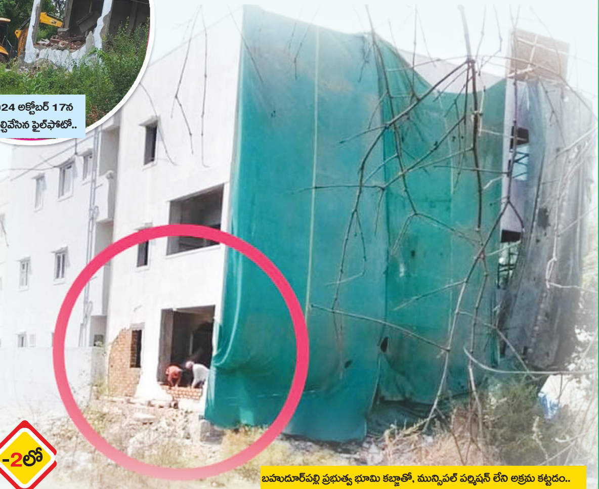
బహుదూర్ పల్లి ప్రభుత్వ భూమి కట్టాతో, మున్సిపల్ పర్మిషన్ లేని అక్రమ కట్టడం..