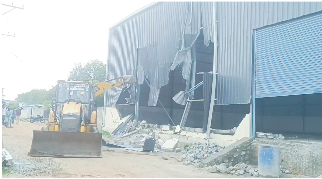
హెచ్ఎండిపి లోకల్ బాడీ ఆదేశాలతో కూల్చివేసిన అక్రమ షెడ్డు.. ఫైల్ ఫోటో..