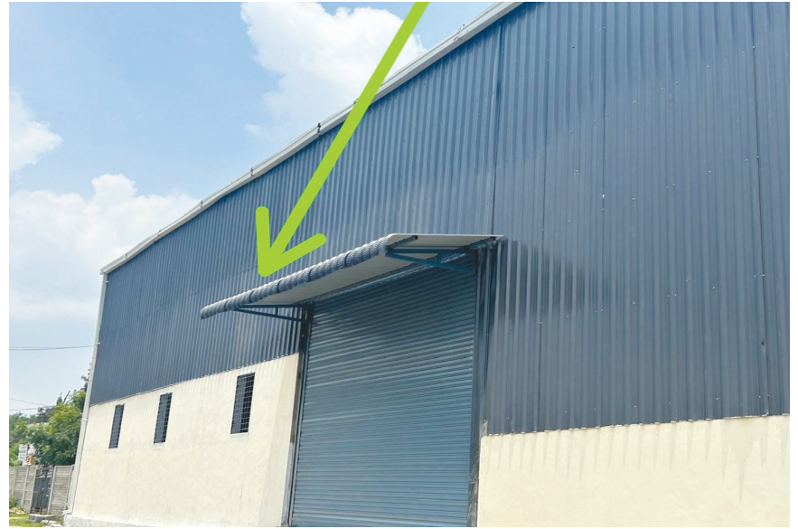
వెంటనే దుండిగల్ మున్సిపల్ అధికారుల సహకారంతో ఇలా..