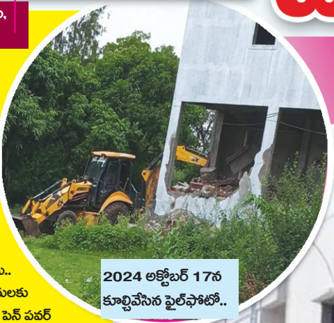
2024 అక్టోబర్ 17న కూల్చివేసిన పైల్ ఫోటో..