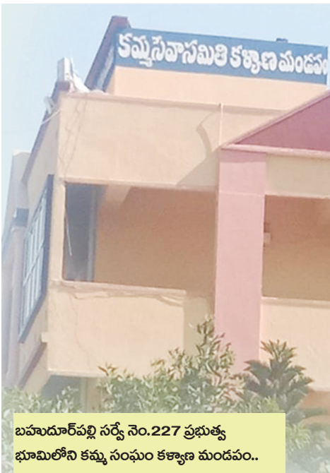
బహుదూర్ పల్లి సర్వే నెం.227 ప్రభుత్వ భూమిలోని కమ్మ సంఘం కార్యాలయ మండపం..