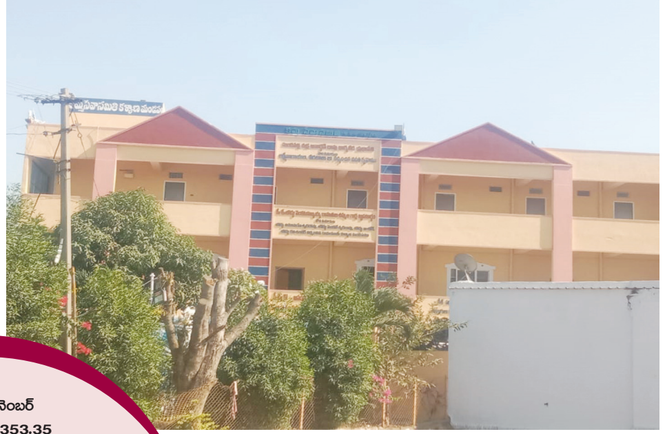
227 ప్రభుత్వ భూమిలో నోటీసులు ఇచ్చిన అక్రమ షెడ్డుపై చర్యలు శూన్యం..