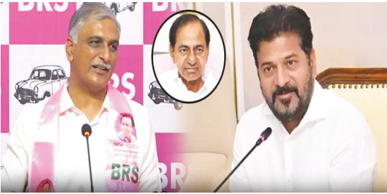
- మిగతా 3లో...

హైదరాబాద్ పెన్ పవర్:సీఎం రేవంత్ రెడ్డిపై మాజీమంత్రి హరీష్ రావు ఫైర్ అయ్యారు. కేసీఆర్ కు రేవంత్ క్షమాపణ చెప్పాలని డిమాండ్ చేశారు. కేసీఆర్ 14 ఏళ్లు పోరాడి తెలంగాణ సాధించి రాష్ట్రానికి దశ దశ చూపారన్నారు. రేవంత్ మాటలతో రాష్ట్ర పరువు పోయిందన్నారు. స్టేషన్ విషయంలో రేవంత్ మాట మార్చారని ఫైర్ అయ్యారు. రేవంత్ బట్టకాల్చి మీద వేస్తున్నారని చెప్పారు. రేవంత్ వ్యక్తిత్వ హాననానికి పాల్పడుతున్నారంటూ ధ్వజమెత్తారు హరీష్. రేవంత్ ప్రభుత్వం అబద్ధాలతో నడుస్తోంది..రేవంత్ అబద్ధాలకు బ్రాండ్ అంబాసిడర్ గా మారారని మండిపడ్డారు హరీష్.