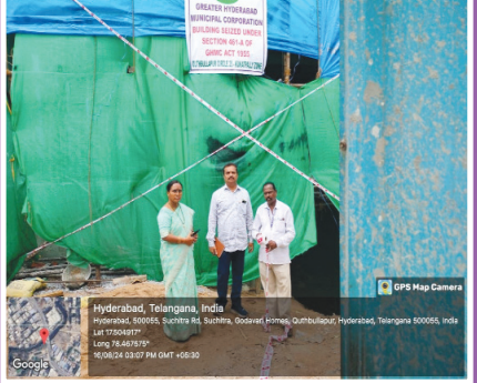
2024 ఆగస్టు 16న ఫాక్స్ సాగర్ నాలాపై కట్టడాన్ని జిహెచ్ఎస్ సర్కిల్-25 సీజ్ ఫైల్ ఫోటో..