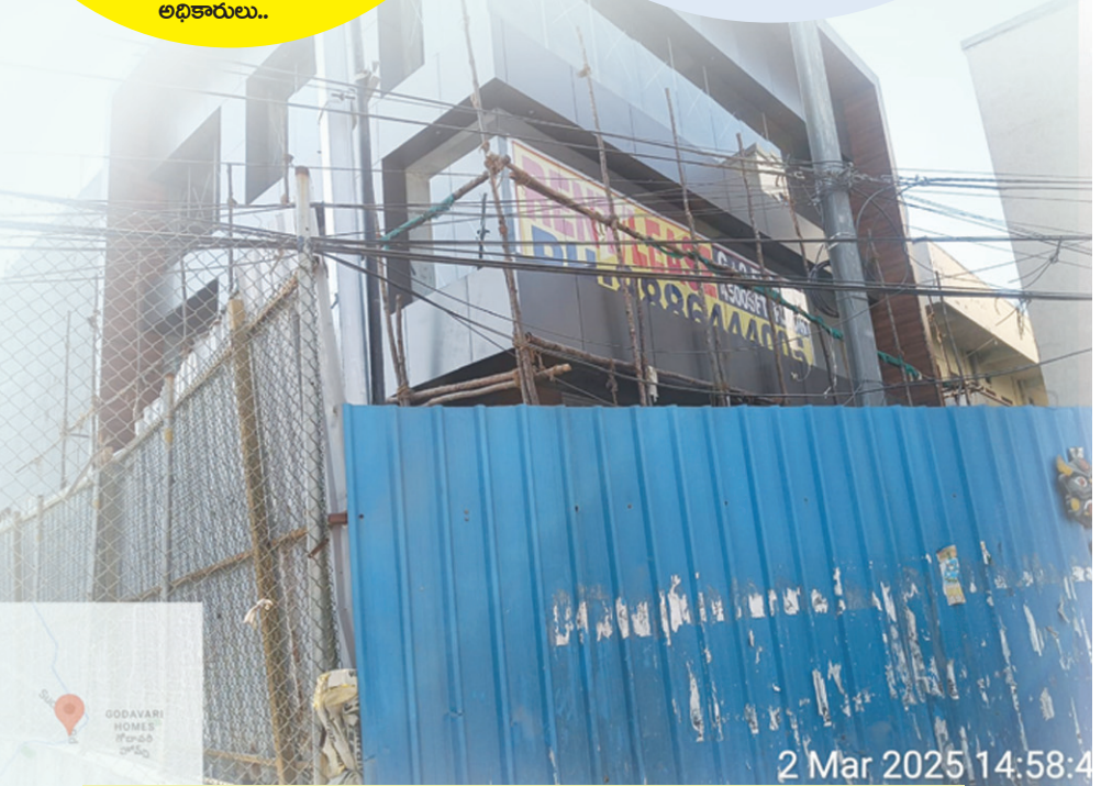
ఫాక్స్ సాగర్ నాలా మీదనే నిర్మించిన అక్రమ నిర్మాణం.. 2024 ఆగస్టు 16న సీజ్ చేసినా, ఇలా పూర్తి..

రెసిడెన్షియల్ పర్మిషన్ తో కమర్షియల్ భవనం నిర్మించిన కొద్దిరోజుల్లోనే.. ఓ అక్రమ నిర్మాణదారుడు.. ఇప్పుడు అదే అక్రమ నిర్మాణానికి చుట్టూ ఉన్న సెట్ బ్యాకుల స్థలం ఆక్రమణతో కమర్షియల్ గా అడ్డెక్కు ఇవ్వడానికి అక్రమ షెడ్యూ నిర్మాణానికి శుక్రవారం పనులు ప్రారంభించారు.. అయితే భవనం చుట్టూ ఉన్న కాంపౌండ్ వాలిపైనే అక్రమ షెడ్యూ గోడలు నిర్మించడం విశేషం.. సదరు నిర్మాణ దారుడు తప్పుల మీద తప్పులు చేస్తుంటే..! సంబంధిత అధికారులు ఏమి పట్టనట్లు వ్యవహరిస్తున్నారని..! ప్రమాదాలు సంభవిస్తే ఎలా కాపాడుతారని పలువురు ప్రశ్నిస్తున్నారు.. మున్సిపల్ చట్టాలను నిర్వీర్యం చేసి, అధికారులు అందినకాడికి దండుకుంటున్నారని ఆరోపిస్తున్నారు..