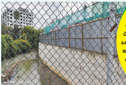
ఫాక్స్ సాగర్ నాలాపై అక్రమ నిర్మాణం.. 2024 జూలై 19న ఇలా.. ఫైల్ ఫోటో..

కుత్బుల్లాపూర్ జిహెచ్ఎస్ కార్యాలయంలో ఒక డిప్యూటీ కమిషనర్.. ఒక అసిస్టెంట్ సీటీ షానర్.. ఒక టౌన్ షానింగ్ సెక్షన్ సూపర్ వైజర్.. టాన్స్ ఫోర్స్ కమిటీకి అక్రమ కట్టడాల సమాచారం చేరవేసి "న్యాక్ ఇంజనీరింగ్" చైన్మెన్లు.. వీళ్ళ అందరిపైన, ఒక జోనల్ కమిషనర్, ఆపై జిహెచ్ఎస్ కమిషనర్.. ఇంతమంది ఉన్నప్పటికీ.. ఇలాంటి అక్రమ కట్టడాలు యధేచ్ఛగా నిర్మిస్తున్నారు.. అయినా ఫాక్స్ సాగర్ నాలా నడిమిట్లనే కడుతుంటే, చర్యలు తీసుకోకుండా నిర్మాణం పూర్తి చేయించిన ఘనులు ఈ సర్కిల్-25 అధికారులు..