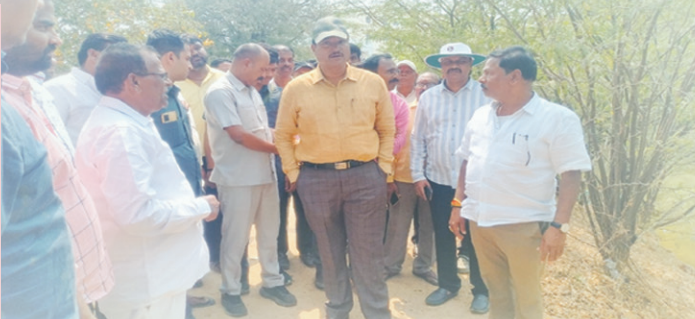
బాబాఖాన్ లేకవిడి నెం. 2856 చెరువును పరిశీలిస్తున్న హైద్రా కమిషనర్ రంగనాథ్..

హైకోర్టు ఉత్తర్వులతో చెరువు నాలాపై ఉన్న ప్రైమార్క్ టవర్లు పరిశీలన..