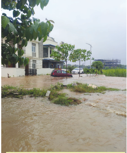
2023 సెప్టెంబర్ 5న భారీ వర్షాలకు శ్రీరామ అయోధ్య విల్లాల్లోకి వరద ఉధృతి.. ఫైల్ ఫోటో..

ఆదేశించింది.. హైకోర్టు ఆదేశాల మేరకు ఆయన రెవెన్యూ, ఇరిగేషన్, మున్సిపల్ అధికారులతో గురువారం బహుదూర్ పల్లి బాబాఖాన్ చెరువును, చెరువు నాలాను సందర్శించి పరిశీలించారు.. నాలాపై ప్రైమార్క్ హైరైజ్ టవర్లు ఉన్నట్లు, స్థానికుల వివరణతో హైద్రా కమిషనర్ స్పష్టతకు వచ్చారు.. వారం రోజుల్లో ఇరు పక్షాలు స్థానిక పెద్దలతో సమావేశమై నాలాను పునరుద్ధరించేందుకు నిర్ణయంతో తెలియ జేయాలని, లేని యెడల హైద్రా పద్ధతిలో చర్యలు ఉంటాయని కమిషనర్ హెచ్చరించారు..