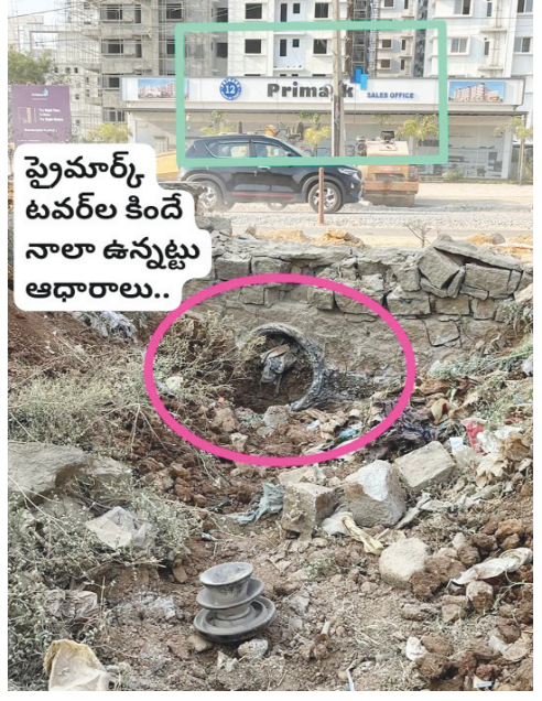
ప్రైమార్క్ టవర్ల కింద నాలా ఉన్నట్లు ఆధారాలు..