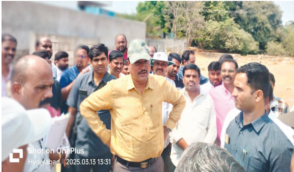
స్థానికులతో కలిసి చెరువు నాలాను పరిశీలిస్తున్న హైద్రా కమిషనర్..

బహుదూర్ పల్లి విలేజ్ మ్యాప్ లో సర్వే నెంబర్ 188, 189, 191 అండ్ 210 మీదుగా నాలా ప్రవహిస్తున్నట్లు స్పష్టంగా ఉంది.. అయినప్పటికీ మూడు శాఖల అధికారుల నిర్వాకం.. గోటితో పోయేది గొడ్డలి వరకు తీసుకొచ్చారు.. వీళ్ళకు తోడు నియోజకవర్గంలోని ఆ ఇద్దరు బీఆర్ఎస్ ప్రజాప్రతినిధులు సహకరించడం.. మరింత అజ్ఞం పోసినట్లు అయింది.. మనది ప్రజాస్వామ్య ప్రభుత్వమే అయినప్పటికీ..! ప్రజా వ్యతిరేక నిర్ణయాలు, నియంతృత్వ ధోరణితో, అధికారులపై పెత్తనం చెలాయించే స్థాయికి ప్రజాప్రతినిధులు ఎదిగారు. అక్రమార్కులకు, సహకరించే నేతల అండ చూసుకుని..! ఇదే అదనుగా కొందరు అవినీతి అధికారులు తమ చేతివెంటనే ప్రదర్శించారు.. దానికి ప్రతిఫలంగా..! ప్రైమార్క్ హైరైజ్ టవర్ల కింద బాబాఖాన్ లేక్ ఓడి 2856 చెరువు నాలా భూ స్థాపితం అయింది..