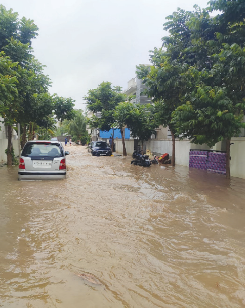
ప్రైమార్క్ నిర్వాకం.. శ్రీరామ అయోధ్య విల్లాల్లో వరదనీరు..

హెచ్ఎండిప అనుమతులతో నిర్మించే ప్రైమార్క్ హైరైజ్ టవర్లకు నిబంధనలు వర్తించనా..? ఆక్యుపెన్సీ సర్టిఫికేట్ మార్టిగేజీ మాత్రమే వర్తిస్తుందా..? ఎన్ఓసి తీసుకోకుండా క్రయవిక్రయాలు జరపడం కరెక్టేనా..? ఆక్యుపెన్సీ సర్టిఫికేట్ పొందకుండా, కొనుగోలు దారులకు ప్లాట్లను అప్పగించవచ్చా..? నిర్మాణాల్లో అవకతవకలు (ఇలాంటి నాలా కట్టలు) జరగకుండా ప్రభుత్వం మార్టిగేజీ రిజిస్ట్రేషన్లు చేసుకుంటుంది.. ఆతర్వాత ఏమైనా తప్పులు జరిగితే..! సంబంధిత కట్టడాల తప్పుడివిగా నిర్ధారించినా మార్టిగేజీ రిలీజ్ చేయకుండా, ఆక్యుపెన్సీ సర్టిఫికేట్ జారీ చేయకుండా అధికారులు చర్యలు చేపడతారు.. కానీ అధికారులు మామూళ్ళ మత్తులో, తప్పుడు స్కెచ్ మ్యాప్లు, ఒక్కో అధికారి ఒక్కో తప్పుడు నివేదికలతో వాస్తవాలను, అవాస్తవాలగా దృవీకరించి ప్రైమార్క్ హైరైజ్ టవర్లకు సహకరించారు.. ఆ మాత్రం దానికి మార్టిగేజీలు, ఆక్యుపెన్సీ సర్టిఫికేట్లు ఎందుకు..?