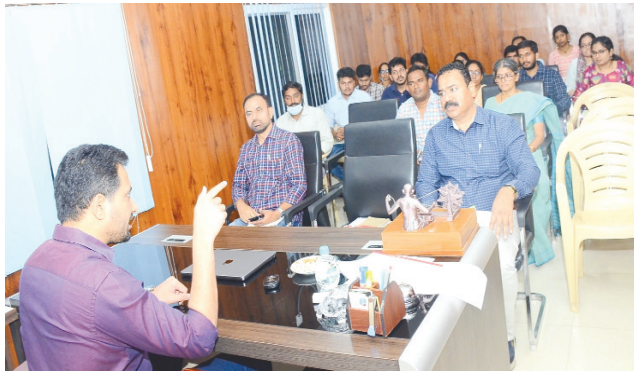
నిజాంపేట్ మున్సిపల్ కార్పొరేషన్ కార్యాలయంలో కలెక్టర్ సమీక్ష..

నిజాంపేట్ కార్పొరేషన్ను సందర్శించిన మేడ్చల్ జిల్లా కలెక్టర్..