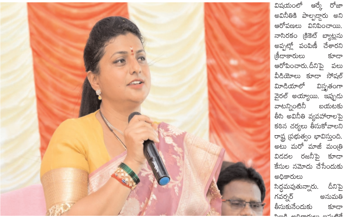
ఆదేశించింది. దీనిపై సోమవారం కూడా అసెంబ్లీలో చర్చ జరిగింది. దాదాపు 119 కోట్ల నిధులు ఆదాం ఆంధ్ర పేరుతో దుర్వినియోగం అయినట్లు గుర్తించారు. ముఖ్యంగా బ్యాంకు అలాగే క్రికెట్ కిట్లు కొనే

గుంటూరు, మార్చి 14, పెన్ పవర్: ఆంధ్రప్రదేశ్ లో వైసిపి నేతల అవినీతి వ్యవహారంపై అధికారులు రాష్ట్ర ప్రభుత్వం గట్టిగానే పోకెన్ పెట్టారు. వైసిపి అధికారంలో ఉన్నప్పుడు చెలరేగిపోయిన నాయకులపై ఇప్పుడు చంద్రబాబు నాయుడు గట్టిగా రృప్తి పెట్టినట్లు తెలుస్తోంది. మాజీ మంత్రుల అవినీతి వ్యవహారంపై లెక్కలు తేల్చేందుకు సిద్ధమవుతున్నట్లు వార్తలు వస్తున్నాయి. చిత్తూరు జిల్లాకు చెందిన పెద్దిరెడ్డి రామచంద్రారెడ్డి పై ఇప్పటికే పలు కేసులు నమోదయ్యాయి. త్వరలోనే ఆయనను అదుపులోకి తీసుకునే అవకాశాలు ఉన్నాయని వార్తలు వస్తున్నాయి. తాజాగా వైసీపీ మాజీ రాజ్యసభ ఎంపీ విజయసాయిరెడ్డి పై కూడా సిబిడి అధికారులు పోకెన్ పెట్టారు. ఇక ఇప్పుడు మాజీ మంత్రి ఆర్కే రోజాపై గట్టి పోకెన్ పెట్టింది రాష్ట్ర ప్రభుత్వం. వైసీపీ అధికారంలో ఉన్న సమయంలో ఇష్టం వచ్చినట్లు మాట్లాడిన ఆర్కే రోజా.. అవినీతి వ్యవహారాల్లో కూడా అదే దూకుడు ప్రదర్శించారనే ప్రచారం అప్పుట్లో పెద్ద ఎత్తున జరిగింది. ప్రధానంగా ఆంధ్ర అనే కార్యక్రమం లో? ఆమె క్రీడా శాఖ మంత్రిగా పెద్ద ఎత్తున దోపిడీకి పాల్పడ్డారనే ఆరోపణలు అప్పుట్లో టిడిపి నేతలు చేశారు. ఇక టిడిపి అధికారంలోకి వచ్చిన తర్వాత ఆమెపై కఠిన చర్యలు ఉండే అవకాశం ఉందని అంచనా వేశారు. అయితే రోజా విషయంలో ఇప్పటివరకు అధికారులు ఎక్కడా దూకుడు ప్రదర్శించలేదు. అటు రాష్ట్ర ప్రభుత్వం కూడా ఆమె విషయంలో సైలెంట్ గానే ఉండిపోయింది. ఇక తాజాగా దీనిపై చంద్రబాబు సర్కార్ కీలక నిర్ణయం తీసుకుంది. గత వైసిపి ప్రభుత్వం హయాంలో ఆయనం ఆంధ్ర పేరుతో భారీగా నిధులు వక్షదారి పట్టినట్లు ఆరోపణలు రావడంతో.. రాష్ట్ర ప్రభుత్వం విచారణకు