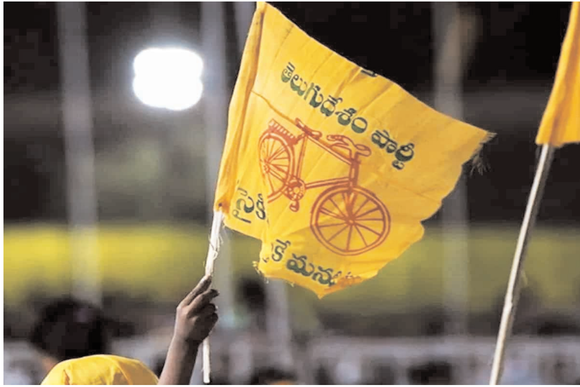
రానున్న కాలంలో కేసీఆర్ కూడా చంద్రబాబుపై విమర్శలు ఎక్కువైతే కూడా అందని పరిస్థితి నెలకొంటుందని చెప్పి ప్రజలను తమ వైపునకు తిప్పుకునే ప్రయత్నం గులాబీ బాస్ చేస్తారంటున్నారు. మొత్తం మీద టీడీపీ ఎంట్రితో కారు పార్టీకి లాభమన్న విశ్లేషణలు బాగా వినపడుతున్నాయి.

హైదరాబాద్, మార్చి 14, పెన్ పవర్: తెలంగాణలో తెలుగుదేశం పార్టీ తిరిగి తెలంగాణ రాజకీయాల్లో యాక్టివ్ కావాలని భావిస్తున్న తరుణంలో బీఆర్ఎస్ శ్రేణుల్లో ఉత్సాహం పెరిగింది. వచ్చే ఎన్నికల్లో గెలుపు తమదేనన్న ధీమా ఆపార్టీలో మరింతగా వ్యక్తమవుతుంది. బీఆర్ఎస్ కు తెలంగాణలో టీడీపీ రీ ఎంట్రి ఉపయోగపడుతుందన్న విశ్లేషణలు కూడా ఊపందుకుంటున్నాయి. ఎందుకంటే ఏ రకంగా చూసినా అది కారు పార్టీకి లాభమేనని, సైకిల్ వస్తే కారు గేర్ మార్చడం ఖాయమన్న కామెంట్స్ సోషల్ మీడియాలో వినపడుతున్నాయి. తెలంగాణ , ఆంధ్రప్రదేశ్ లుగా విడిపోయిన తర్వాత తెలంగాణలో తెలుగుదేశం పార్టీ బలహీనంగా మారిందనడంలో ఎలాంటి సందేహం లేదు. అందరూ ఒప్పుకుని తీరాల్సింది. అయితే టీడీపీ ఓటు బ్యాంకు 2014, 2018 ఎన్నికల్లో బీఆర్ఎస్ కు టర్న్ అయ్యాయి. తర్వాత 2023 ఎన్నికల్లో టీడీపీలో అత్యధికకాతం ఓట్లు కాంగ్రెస్ కు మళ్లాయుంటారు. పీసీసీ చీఫ్ గా రేవంత్ రెడ్డి ఉండటంతో తెలుగుదేశం పార్టీ క్యాడర్ తో పాటు ఓటర్లు కూడా గాంధీ భవన్ వైపు మొగ్గు చూపారన్న వాదనలో నిజమంది. 2023 శాసనసభ ఎన్నికల్లో హైదరాబాద్ లో కాంగ్రెస్ పార్టీకి స్థానాలు దక్కకపోయినా ఖమ్మం, నల్లగొండ, మహబూబ్ నగర్, నిజామాబాద్ జిల్లాల్లో పార్టీకి సాఫ్ట్ గా సీట్లు రావడం కూడా టీడీపీ ఓటు బ్యాంకు సహకారం వల్లనేనన్నది కొందరి విశ్లేషణగా ఉంది. 2018లో మహా కూటమిలో కాంగ్రెస్ తో కలిసి టీడీపీ పోటీ చేయడంతో అధికారంలోకి రాలేదన్న కామెంట్స్ కూడా నాడు వినిపించాయి. ఇప్పుడు బీజేపీతో పాటుగా తెలంగాణలో తెలుగుదేశం పార్టీ రాసుందన్న వార్తలు కారు పార్టీ నేతలకు ఖుషి కలుగుతూ అనుకోవాల్సి ఉంటుంది. బీజేపీతో పాటు పెట్టుకున్న టీడీపీని, కాంగ్రెస్ ను వేరుగా చూడలేరని, అందుకే ఈసారి ఎన్నికల్లో జనం తమ వైపు తిరుగుతారని గట్టి అంచనాలు వినపడుతున్నాయి.