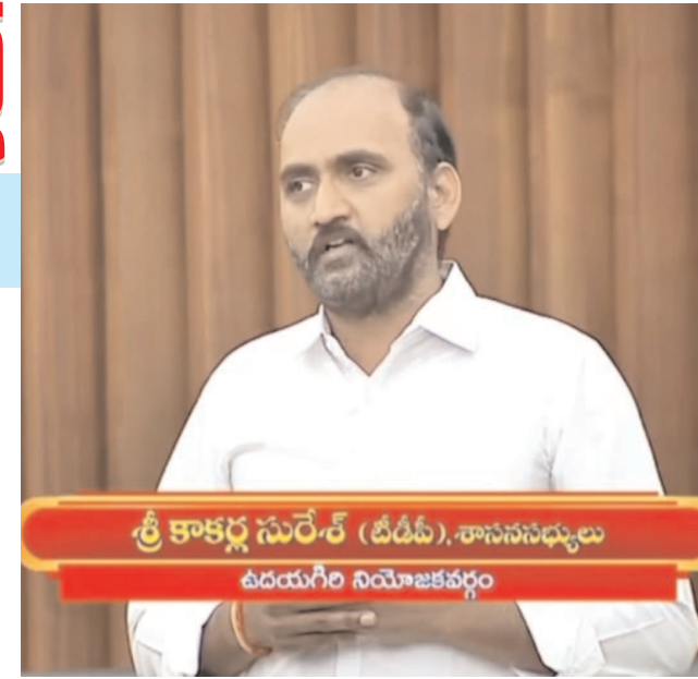
రిజర్వాయర్ కాలువల పూడిక తీత పనులు చేపట్టాలని తెలియజేశారు. సొంత నిధులతో కొన్ని కాలువల పూడికతీత పనులు పూర్తి చేసి 4 వేల ఎకరాలకు సాగునీరు అందించామని, మొత్తం అయకట్టు 16 వేల ఎకరాలని, ఆ భూమిని కూడా సాగులోని తెచ్చేందుకు నిధులు మంజూరు చేయాలని కోరారు.