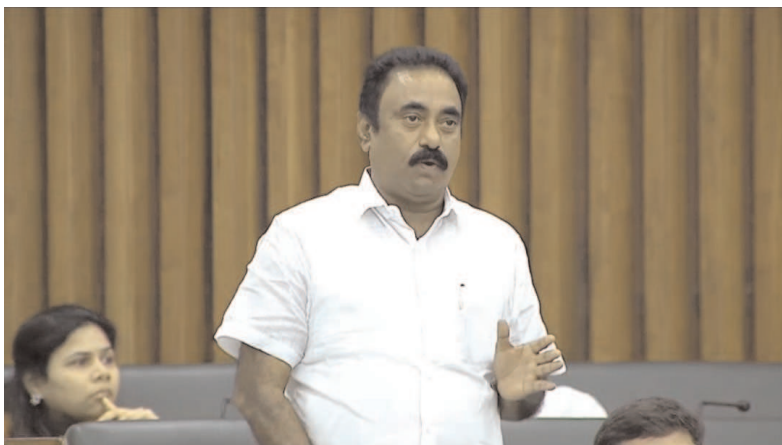
కావలి పెన్ పవర్ - మర్చి 5 : ప్రతి ఒక్కరికీ కూడు గూడు గుడ్డు ఇవ్వాలనే సిద్ధాంతాలతో మాజీ ముఖ్యమంత్రి స్వర్ణయ్య నందమూరి తారక రామారావు తెలుగుదేశం పార్టీని స్థాపించారని ఎమ్మెల్యే దగ్గరమాటి వెంకట

కొట్టే ప్రభుత్వం పోయింది.. పెట్టే ప్రభుత్వమే వచ్చింది.. అసెంబ్లీలో ప్రజా సమస్యలపై గళంమెత్తిన ఎమ్మెల్యే