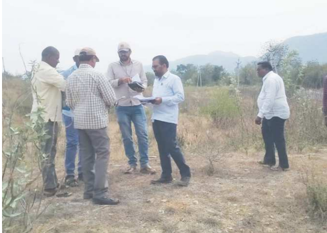
కొమరోలు పెన్ పవర్ మార్చి 4

కొమరోలు మండలంలో 12 రోడ్ల తనిఖీ -క్వాలిటీ కంట్రోల్ అధికారి, గిద్దలూరు హౌసింగ్ డి ఈ షేక్ ఖద్దీర్ ఖాష.