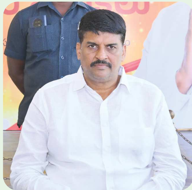
పెన్ పవర్ బ్యూరో బాపట్ల మార్చి 4:

పట్టభద్రులకు హృదయపూర్వక ధన్యవాదాలు ఎమ్మెల్యే సరేంద్ర వర్మ రాజు