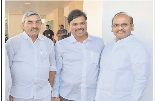
పెన్ పవర్ చిలకలూరిపేట మార్చి 4: