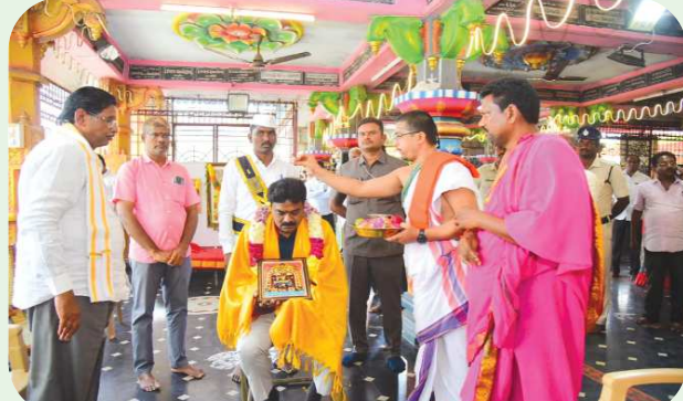
పెన్ పవర్ బ్యూరో బాపట్ల మార్చి 4: