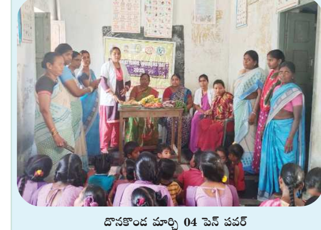
దాసకొండ మార్చి 04 పెన్ పవర్