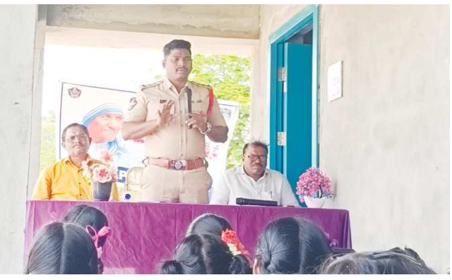
వేటపాలెం, పెన్ పవర్, మార్చి 04