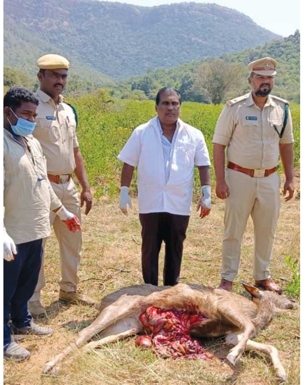
చంద్రశేఖరపురం, పెన్ పవర్, మార్చి 3