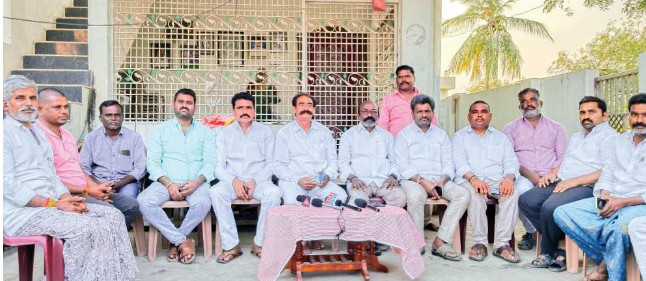
పుల్లల చెరువు పెన్ పవర్ మార్చి 3

ప్రశ్నించిన వారిని భయభ్రాంతులకు గురిచేస్తున్న కూటమి ప్రభుత్వం