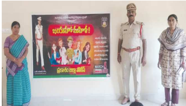
కొమరోలు పెన్ పవర్ మార్చి 3

జాతీయ మహిళా దినోత్సవాన్ని పురస్కరించుకొని బాలికలకు వ్యాసరచన పోటీలు నిర్వహణ.