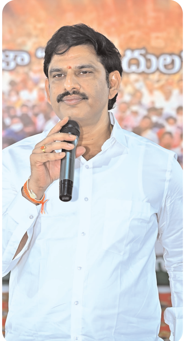
అందించనున్నట్లు తెలిపారు. గ్రామాల సర్వోత్తమఖాభివృద్ధి కోసం కూటమి ప్రభుత్వం కృషి చేస్తుందన్నారు. అన్ని గ్రామాలలో ప్రత్యేక ప్రజాశిక్షణ ద్వారా మంచినీటి సమస్యకు శాశ్వత పరిష్కారం చూపిస్తామన్నారు.