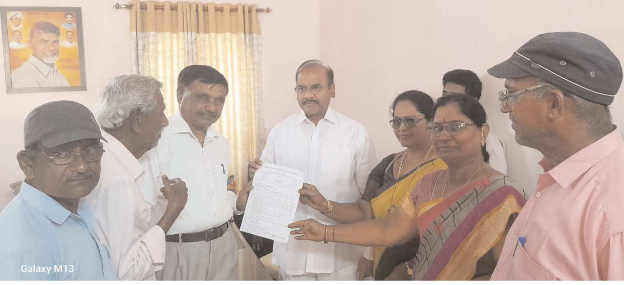
పెన్ పవర్ చిలకలూరిపేట మార్చి 2:

ఎమ్మెల్యే ప్రతిపాటి పుల్లారావుకు వినతి పత్రం అందజేత