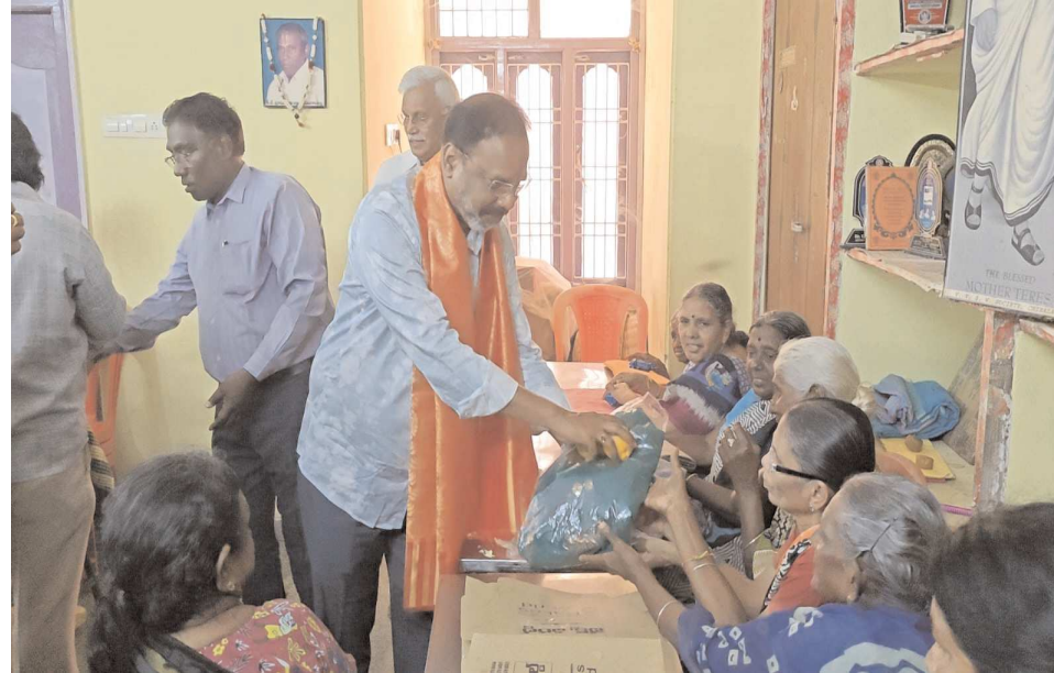
చీరాల, పెన్ పవర్, మార్చి 02