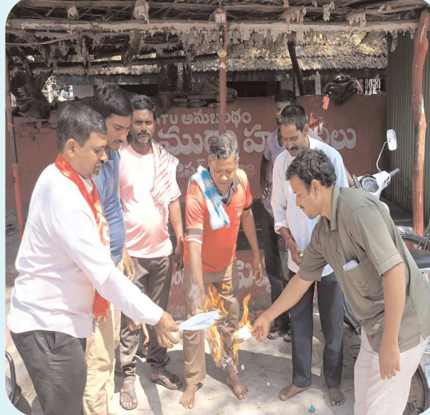
గిద్దలూరు పెన్ పవర్ మార్చి 2

బడ్జెట్ ప్రతులు దహనం చేసిన సిపిఎం నాయకులు.