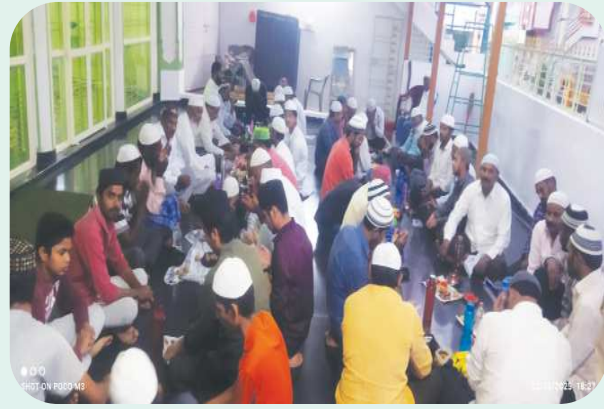
కొమరోలు పెన్ పవర్ మార్చి 2

రంజాన్ మాసపు ఉపవాస దీక్షా పరులతో మండలంలోని మసీదులు కళకళలాడుతున్నాయి. రంజాన్ మాసపు నెలవంక శనివారం సాయంత్రం కనిపించింది. దీనితో ఆదివారం నుంచి ముస్లిం సోదరులు, మహిళలు ఉపవాసా దీక్షలు చేపట్టారు. ఆదివారం సాయంత్రం తో తొలిరోజు ఉపవాసా దీక్ష ముగిసింది. ఇఫ్తార్ లో (ఉపవాసం ముగించే సమయం) పాల్గొనేందుకు ఆదివారం సాయంత్రం ఆరున్నర గంటలకు ముస్లిం సోదరులు పెద్దలు, పిల్లలు వృద్ధులు తరలిరావడంతో మసీదులు ఉపవాస దీక్షపరులతో నిండి కళకళలాడాయి. రంజాన్ మాసంలో తొలిరోజు కొమరోలు జామియా మసీదు మత పెద్దల ఆధ్వర్యంలో కొమరోలు లోని మూడు మసీదుల పరిధిలోగల ఉపవాస దీక్షాపరులకు, మగరీబ్ సమాజ్ హాజరైన ముస్లిం సోదరులందరికీ ఇఫ్తార్ విందు జామియా మసీదు ప్రాంగణంలో ఏర్పాటు చేశారు. భారీ సంఖ్యలో ముస్లిం సోదరులు తరలిరావడంతో ఇఫ్తార్ విందు రాత్రి 8 గంటల వరకు కొనసాగింది.