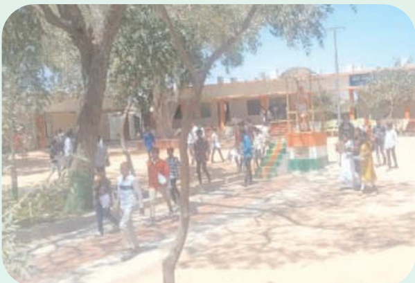
పెన్ పవర్ తరఫున మార్చి 17