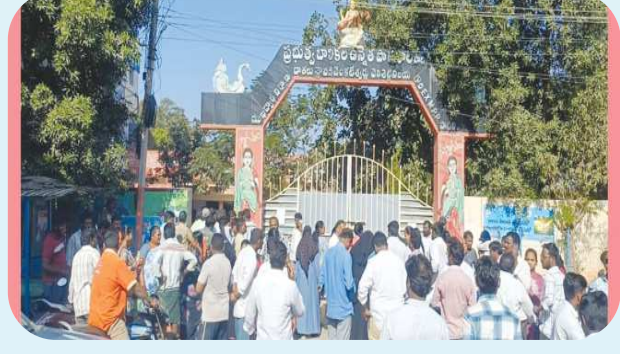
పొదిలి, పెన్ పవర్ మార్చి 17