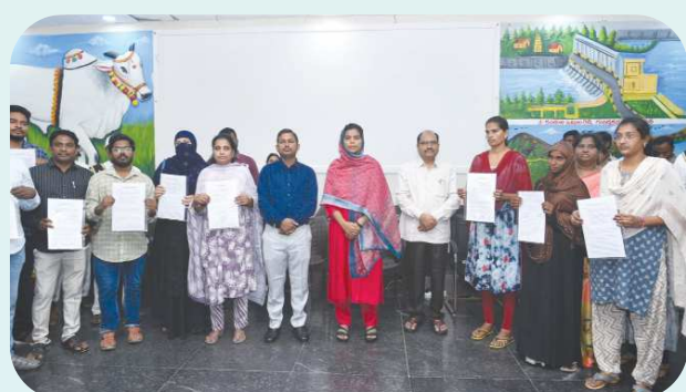
కలెక్టరేట్ ఒంగోలు, పెన్ పవర్ మార్చి 17

ప్రభుత్వ సర్వీసులో చేరిన వారు చిత్తుకుడితో పనిచేయాలని జిల్లా కలెక్టర్ వి. తమిళం అనారోగ్యం చెప్పారు. కారుణ్య కోటాలో అరులైన 38 మందికి సోమవారం (గ్రీవెస్) హాటు ఆమె నియామక పత్రాలను అందించారు. ప్రభుత్వ సర్వీస్ లోకి వస్తున్నందుకు వారికి శుభాకాంక్షలు తెలిపారు. వృత్తిపరమైన వైభవం పెంచుకుంటూ ప్రజలకు మెరుగైన సేవలు అందించాలని కలెక్టర్ సూచించారు. ఈ కార్యక్రమంలో జాయింట్ కలెక్టర్ ఆర్. గోపాలకృష్ణ, డి.ఆర్. ఓ. బి. చిన ఓబలేను, ఇతర అధికారులు పాల్గొన్నారు.