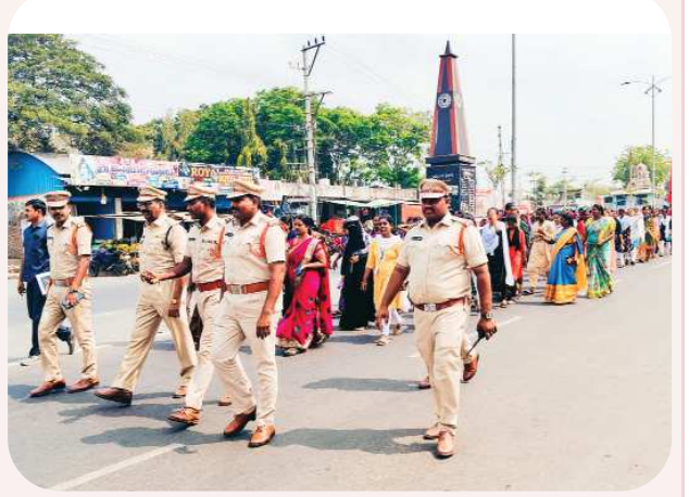
పెన్ పవర్ బ్యూరో బాపట్ల మార్చి 8