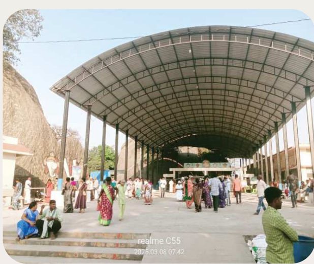
పలేటివారిపాలెం పెన్ పవర్ చూర్చి 8