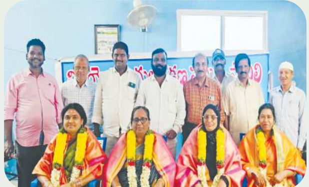
పొదిలి, పెన్ పవర్ చూర్చి 8