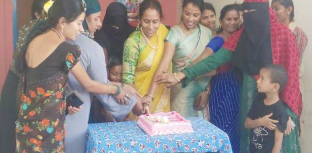
కొమరోలు పెన్ పవర్ మార్చి 8

తల్లిగా, చెల్లిగా, ఇల్లలుగా, ఉపాధ్యాయురాలుగా, విమాన సైబల్ గా ఒక శక్తిగా రాణిస్తున్న మహిళలను ఆదరించాలి.