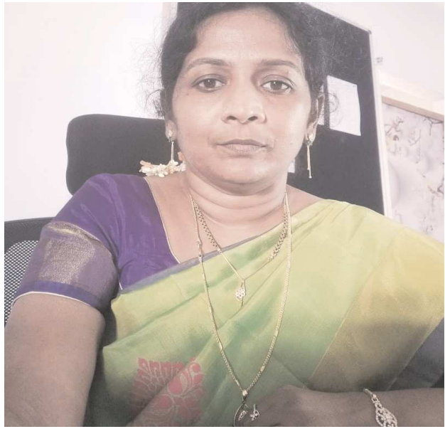
పెన్ పవర్ కారంపూడి మార్చి 15వ