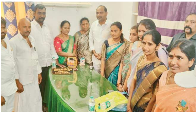
పెద్ద డోర్నాల పెన్ పవర్ మార్చి 15

- ఇటీవల మండల పరిషత్ నిధులను దుర్వినియోగంపరిచిన ఎంపీడివో నానా రెడ్డి పై చర్యలు తీసుకోవాలని ఉన్నతాధికారులతో మాట్లాడిన ఎమ్మెల్యే చంద్రశేఖర్ -ఎంపీడివో ను సస్పెండ్ చేయాలి నినాదాలు