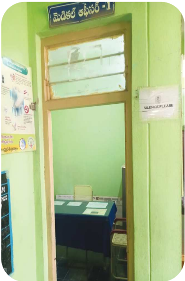
గిద్దలూరు పెన్ పవర్ మార్చి 15

గిద్దలూరు నియోజకవర్గం రాజర్ల మండలం అనుమలవీడు గ్రామములో ఉన్న ప్రభుత్వ హాస్పిటల్ ఇది. ఇక్కడ డాక్టర్లు ఎప్పుడు వస్తారో ఎప్పుడు పోతారో తెలియదు.