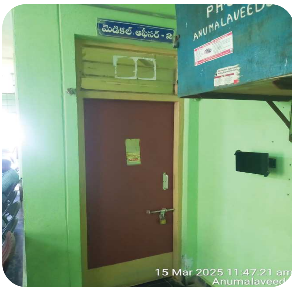
15 Mar 2025 11:47:21 am Anumalaveedu

గిద్దలూరు నియోజకవర్గం రాజర్ల మండలం అనుమలవీడు గ్రామములో ఉన్న ప్రభుత్వ హాస్పిటల్ ఇది. ఇక్కడ డాక్టర్లు ఎప్పుడు వస్తారో ఎప్పుడు పోతారో తెలియదు.