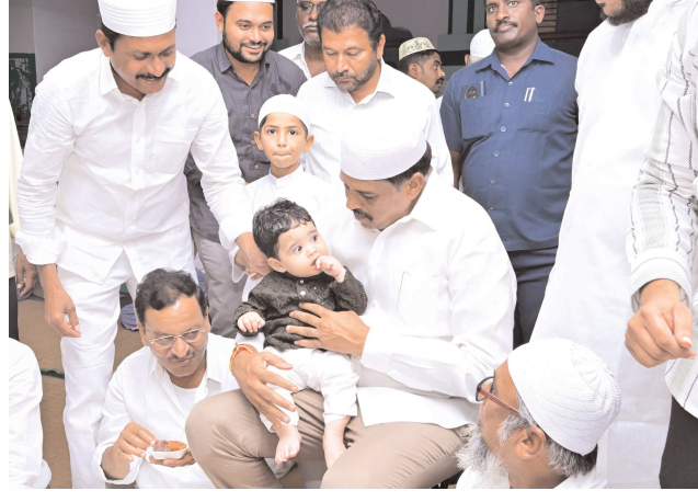
పెన్ పవర్ బ్యాంకో బాపట్ల మార్చి 15:

బాపట్ల నియోజకవర్గం పిట్టలవాని పాలెం మండలం చందోలు లో వేగేశన ఫౌండేషన్ ఆధ్వర్యంలో ఇఫ్తార్ విందు కార్యక్రమంలో గుంటూరు తూర్పు నియోజకవర్గ ఎమ్మెల్యే అబ్దుల్ నజీర్ తో కలిసి బాపట్ల నియోజకవర్గ ఎమ్మెల్యే , వేగేశన ఫౌండేషన్ చైర్మన్ వేగేశన