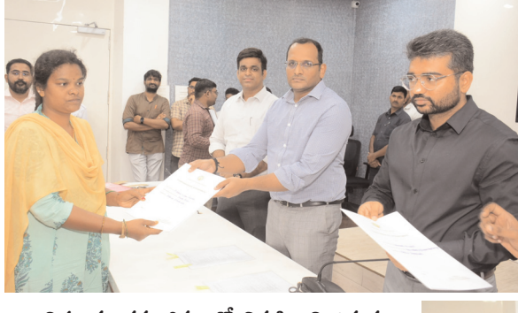
విధులను క్రమ శిక్షణ తో నిర్వహించి ఉన్నత శిఖరాలకు చేరుకోవాలి క్రమ శిక్షణతో అధికారులు అప్పజెప్పిన విధులను నిర్వహించాలి