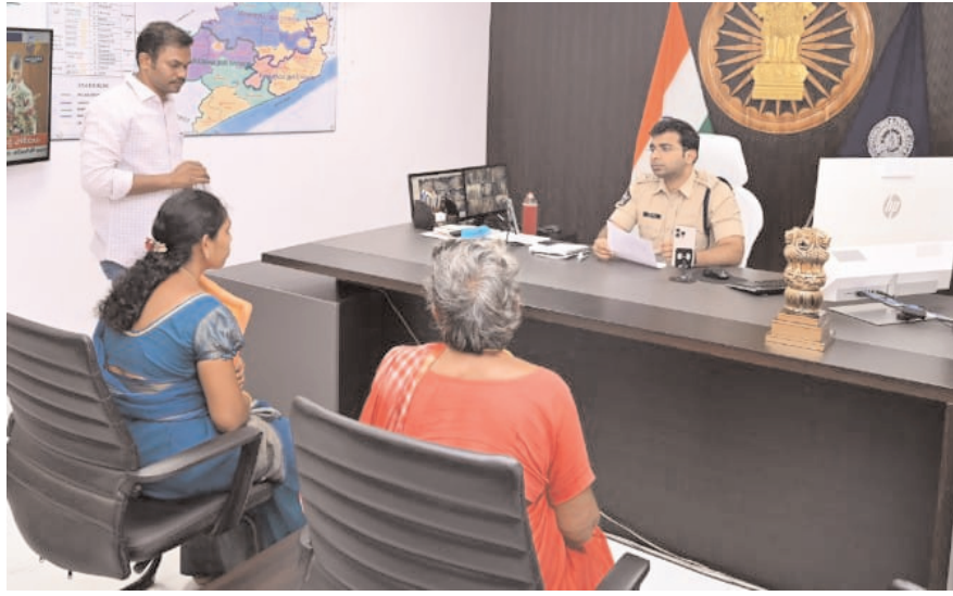
పోలీసు సిబ్బంది మరియు హోంగార్లు హాజరై ఆరోగ్య, ఉద్యోగ, వ్యక్తిగత సమస్యలను జిల్లా ఎస్సీకి వివరించారు. వీటి పరిష్కారానికి ఆయన సానుకూలంగా స్పందించి, ఆయా విజ్ఞప్తలను పరిశీలించి, తక్షణమే తగిన చర్యలు తీసుకోవాలని సంబంధిత అధికారులకు ఆదేశాలు ఇచ్చారు. పోలీసు సిబ్బంది సంక్షేమం తమ