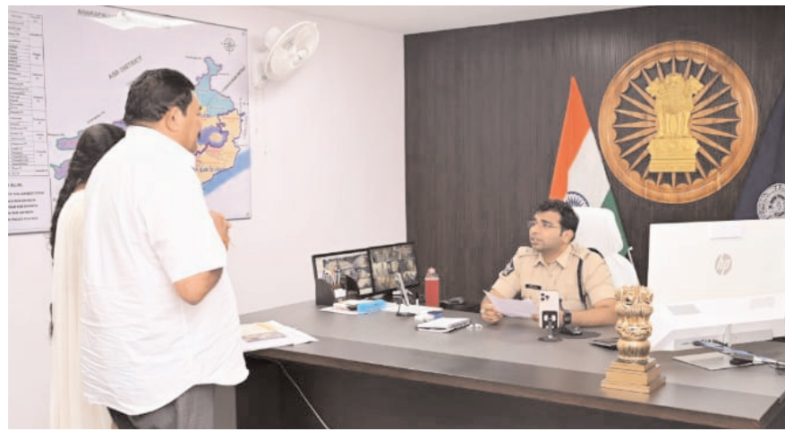
అనకాపల్లి, పెన్ పవర్, మార్చి 28 : పోలీసు సిబ్బంది సమస్యల పరిష్కారానికి జిల్లా ఎస్సీ తుహిన్ సిన్హా ఆధ్వర్యంలో పోలీస్ గ్రీవెన్స్ నిర్వహించారు. అనకాపల్లి జిల్లా పోలీసు శాఖలో పనిచేస్తున్న వివిధ స్థాయిల సిబ్బందికి ఎదురయ్యే సమస్యలను స్వయంగా పరిష్కరించేందుకు జిల్లా ఎస్సీ తుహిన్ సిన్హా తన కార్యాలయంలో పోలీస్ గ్రీవెన్స్ కార్యక్రమాన్ని నిర్వహించారు. ఈ కార్యక్రమంలో