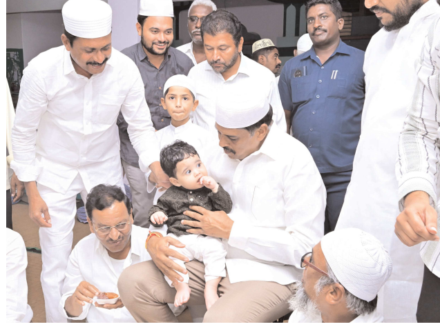
పెన్ పవర్ బ్యూరో బాపట్ల మార్చి 15:

బాపట్ల నియోజకవర్గం పిట్టలవాని పాలెం మండలం చందోలు లో వేగేశన ఫౌండేషన్ ఆధ్వర్యంలో ఇఫ్తార్ విందు కార్యక్రమంలో గుంటూరు తూర్పు నియోజకవర్గ ఎమ్మెల్యే అబ్దుల్ నజీర్ తో కలిసి బాపట్ల నియోజకవర్గ ఎమ్మెల్యే, వేగేశన ఫౌండేషన్ చైర్మన్ వేగేశన