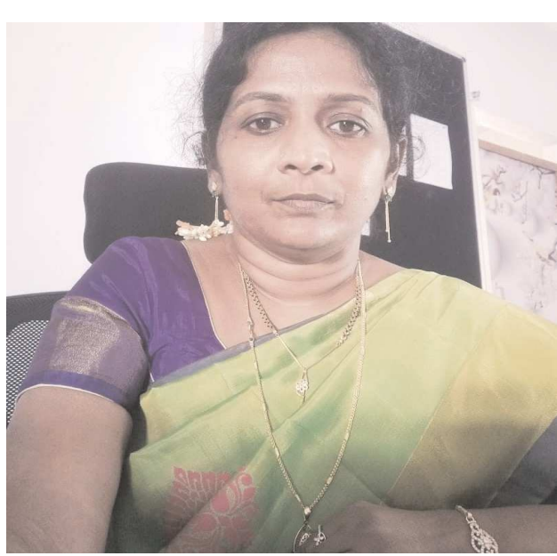
పెన్ పవర్ కారంపూడి మార్చి 15వ