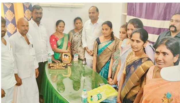
పెద్ద దోర్నాల పెన్ పవర్ మార్చి 15