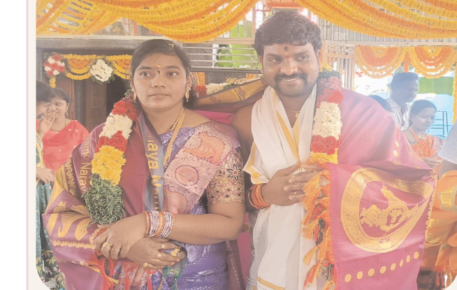
రిపోర్టర్ పొదిలి, పెన్ పవర్ మార్చి 21

- దంపతులను ఆశీర్వదించిన పలువురు నాయకులు అధికారులు ప్రజలు అభిమానులు