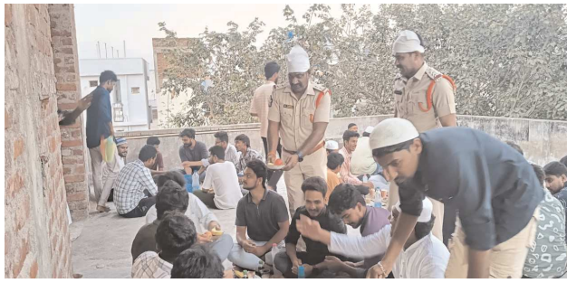
పెద్దలతో కలిసి ప్రత్యేక దువా కార్యక్రమంలో పాల్గొన్నారు. అనంతరం వారు మాట్లాడుతు పవిత్ర గ్రంథమైన ఖురాన్ అవతరించిన నెల ముస్లిం సోదరుల జీవితాలలో అత్యంతంగా ప్రభావం చూపుతుందని అన్నారు. రంజాన్ మాసంలో ఉపవాసదీక్ష చేయడంతో పాటు, జకాత్, సదకా, ఫిల్త్రా, లాంటి నియమ సిద్ధాంతాలపై పేదవాని ఆకలి తీర్చే ప్రయత్నం మానవత