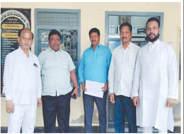
కనిగిరి ఆర్గీఇంచార్జి పెన్ పవర్ మార్చి 21

భవిష్యత్తు తరాలకు మెరుగైన ప్రపంచాన్ని సృష్టిద్దాం