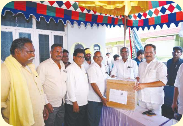
పెన్ పవర్ స్టాఫ్ రిపోర్టర్ బాపట్ల మార్చి 22: