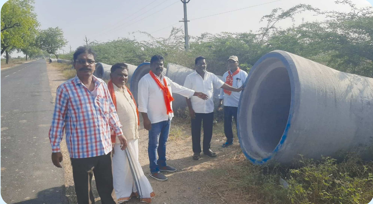
పొదిలి, పెన్ పవర్ మార్చి 19