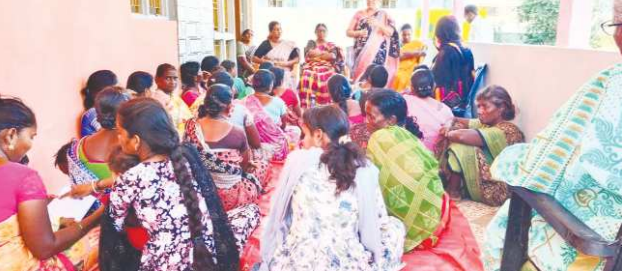
గుడ్లూరు, పెన్ పవర్, మార్చి 19: