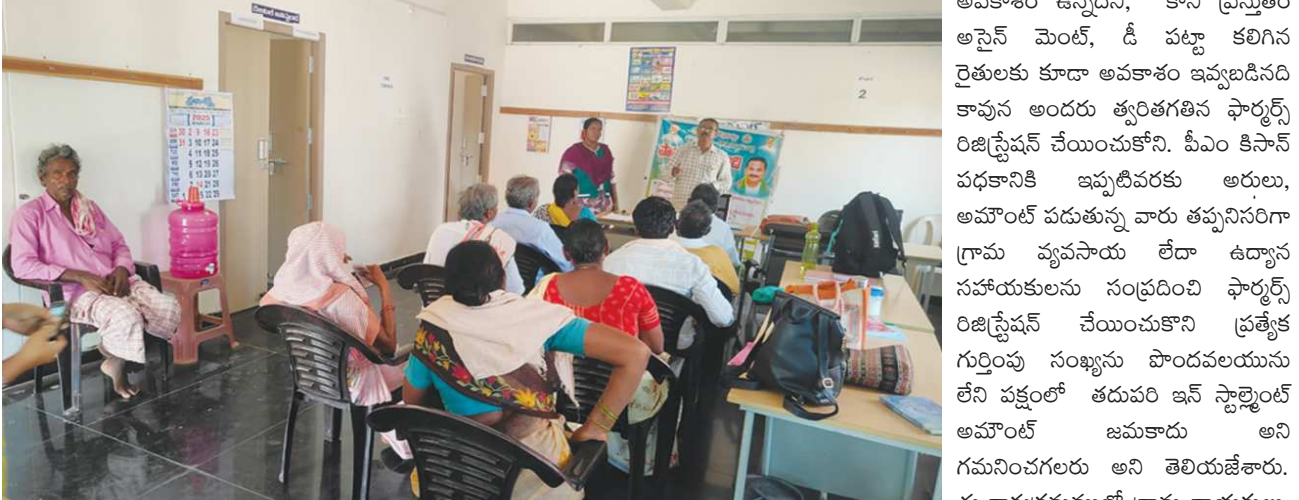
గుడ్లూరు, పెన్ పవర్, మార్చి 18: మరియు రైతులు పాల్గొన్నారు.

గుడ్లూరు-2, గుండ్లపాలెంలలో పొలం పిలుస్తోంది కార్యక్రమం