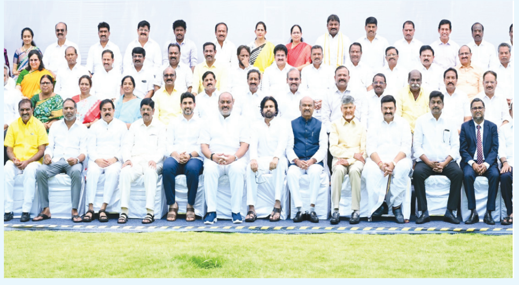
ఎమ్మెల్యేలతోనూ చంద్రబాబు, పవన్, లోకేశ్ గ్రూప్ ఫోటో దిగారు. ఈ ఫోటోలో మందలి చైర్మన్ కొయ్యే మోషన్ రాజు, వైసీపీ ఎమ్మెల్యే బొత్తు సత్యనారాయణ కూడా ఉన్నారు.

పెన్ పవర్ డెస్క్ అసెంబ్లీలో ఎమ్మెల్యేలందరూ గ్రూప్ ఫోటో దిగారు. ముఖ్యమంత్రి చంద్రబాబునాయుడు, డిప్యూటీ సీఎం పవన్ కల్యాణ్ కూడా ఈ ఫోటోల్లో ఉన్నారు. ఈ ఫోటో షూట్ పై డిప్యూటీ స్పీకర్ రఘురామకృష్ణరాజు స్పందించారు. అసెంబ్లీ ఆవరణలో ఈరోజు ఎమ్మెల్యేలు అందరూ గ్రూప్ ఫోటో తీసుకోవడం జరిగిందని వెల్లడించారు. ఇది ప్రజాస్వామ్య ప్రయాణానికి గుర్తుగా, రాజీయే తరాలకు సూర్యులయ్యకంగా నిలుస్తుందని అభివర్ణించారు. సీఎం చంద్రబాబు, ఉపముఖ్యమంత్రి పవన్ కల్యాణ్, స్పీకర్ అయ్యన్న పాత్రుడు, మంత్రులు, ఎమ్మెల్యేలు ఈ ప్రత్యేక ఫోటో షూట్ లో పాల్గొన్నారు. రఘురామకృష్ణరాజు వివరించారు. ఈ ఫోటోలో ప్రతిబింబించిన ఐక్యత, బాధ్యత, ప్రజలకు అందించే సేవల పట్ల నిబద్ధత మన ప్రజాస్వామ్య వ్యవస్థ గౌరవాన్ని మరింత ఇసుమడించజేస్తుందని పేర్కొన్నారు. ఈ మేరకు ఆయన ఎమ్మెల్యేల గ్రూప్ ఫోటోలను సోషల్ మీడియాలో పంచుకున్నారు. అటు,