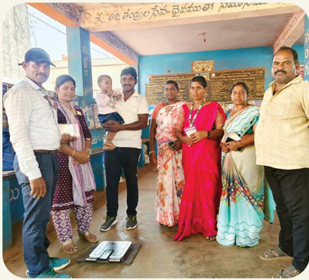
గుడ్లూరు, పెన్ పవర్, మార్చి 18: