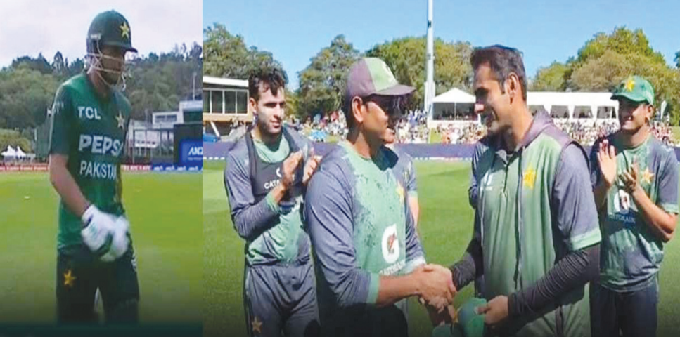
అఫ్రిది (22) రాజించారు. లక్ష్మ ఛేదనలో సీఫెర్డ్ (45), ఫిన్ అలెన్ (38) చెలరేగడంతో 13.1 ఓవర్లలో 137 పరుగులు చేసి గెలిచింది. ఈ విజయంతో 5 మ్యాచ్ ల టీ20 సిరీస్ లో న్యూజిలాండ్ 2-0 ఆధిక్యంలో నిలిచింది. ఇరు జట్ల మధ్య నాలుగో టీ20 శుక్రవారం (మార్చి 21) జరుగుతుంది.

హైదరాబాద్ పెన్ పవర్: ప్రయోగాలు చేసి న్యూజిలాండ్ వర్షుటను వెళ్లిన పాకిస్థాన్ క్రికెట్ జట్టుకు వరుస పరాజయాల పలకరించాయి. 5 మ్యాచ్ ల టీ20 సిరీస్ లో 0-2 తో వెనకపడ్డారు. ఈ సిరీస్ లో పాకిస్థాన్ యువ ఓపెనర్ హసన్ నవాజ్ తొలి రెండు మ్యాచ్ లకే చెత్త రికార్డును తన ఖాతాలో వేసుకున్నాడు. దేశవాళీ క్రికెట్ లో పవర్ ఫుల్ హిట్టర్ గా పేరొందిన హసన్ ఆడిన రెండు మ్యాచ్ లో డకౌటయ్యాడు. దీంతో ఈ పాకిస్థాన్ ఓపెనర్ తన మొదటి రెండు టీ20 ఇన్నింగ్స్ లో వరుసగా రెండు డకౌట్లైన ఆరవ ఆటగాడిగా నిలిచాడు. మాథ్యూ సింకెర్ (న్యూజిలాండ్), జో డెన్సి (ఇంగ్లాండ్), ఇమ్రూల్ కేన్ (బంగ్లాదేశ్), కైల్ జార్విస్ (జింబాబ్వే), అర్షద్ ఇక్బాల్ వారు ఆడిన తొలి రెండు మ్యాచ్ లో డకౌటయ్యారు. తాజాగా నవాజ్ వారి సరసన చేరాడు. నవాజ్ రెండు సార్లు తొలి ఓవర్ లోనే పేసర్ జాకేట్ డఫ్ బొలింగ్ లో ఔటవ్వడం విశేషం. క్రిస్టెన్సన్ జరిగిన తొలి టీ20 మ్యాచ్ కేవలం రెండు బంతులకే డకౌట్ కాగా.. సోమవారం (మార్చి 18) దునెడిన్ లో జరిగిన రెండో టీ20 లో మూడు బంతులకే పరుగులేమీ చేయకుండా పెవిలియన్ దారి పట్టాడు. ఈ మ్యాచ్ విషయానికి వస్తే 15 ఓవర్లకు కుదించిన ఈ మ్యాచ్ లో 136 పరుగుల లక్ష్యాన్ని న్యూజిలాండ్ 13.1 ఓవర్లలో ఛేజ్ చేసింది. టాన్ ఓడి మొదటి బ్యాటింగ్ చేసిన న్యూజిలాండ్ నిర్ణీత 15 ఓవర్లలో 9 వికెట్ల నష్టానికి 135 పరుగులు చేసింది. సల్యాన్ ఆఫూ 46 పరుగులు చేసి టాప్ స్కోరర్ గా నిలిచాడు. షాదాజ్ ఖాన్ (26), షహీన్