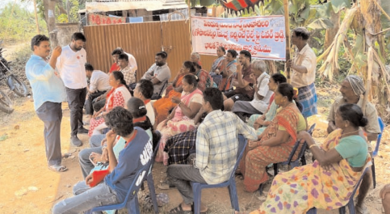
పెండుర్తి భారత కమ్యూనిస్టు పార్టీ (సిపిఐ)

పెండుర్తి, పెన్ పవర్, మార్చి 14 : సమగ్ర విచారణ చేపట్టి బాధిత రైతులకు న్యాయం చేయాలని, భారత కమ్యూనిస్టు పార్టీ సిపిఐ రైతులకు సంఘీభావం తెలిపారు. నార్త్ సింహాచలం నుంచి పెండుర్తి వరకు పై ఓవర్ ట్రిబ్లీ ఇటీవల నిర్వహించేందుకు రైల్వే అధికారులు