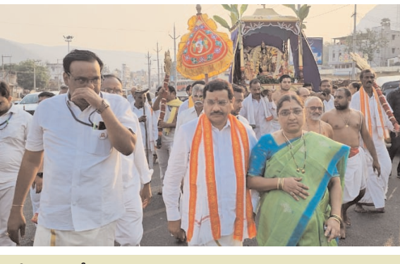
శ్రీ వరాహలక్ష్మీనరసింహస్వామివారి కన్నుల పండుగ దోలోత్సవం

సింహాచలం, పెన్ పవర్, మార్చి 14 : అప్పన్న ఆలయములో వార్షికోత్సవాలలో భాగంగా పూర్ణిమ రోజున దోలోత్సవం ఆనవాయితీ నిర్వహించారు. ఈ ఉత్సవాన్ని గ్రామీణులు బోధించుకున్న పుస్తకాన్ని వ్యవహరిస్తారు. స్వామి వార్డు తిరుకల్వాణోత్సవం శుక్రవారం గ్రామదేవత పైడితల్లమ్మ కుమార్తెతో పూర్ణిమ రోజున నిశ్చితార్థం చేసుకుంటూదని గ్రామీణులు పుక్కిల పురాణం. ఉత్సవాన్ని పురస్కరించుకుని మెట్ల మార్గంలో స్వామిని కొండదిగవకు తీసుకురాగా, సోదరి పైడితల్లమ్మతల్లి ఆలయానికి వెళ్లి వచ్చిన తర్వాత ప్రధాన కూడలిలోని పుష్పరిణి మండపంలో ఆలయ పండితులు దోలోత్సవం, ఘనంగా నిర్వహించారు. అనంతరం