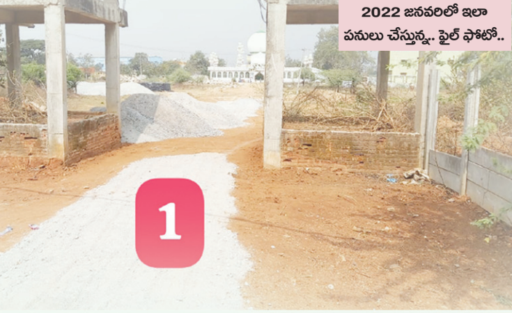
2022 జనవరిలో ఇలా పనులు చేస్తున్న.. ఫైల్ ఫోటో..