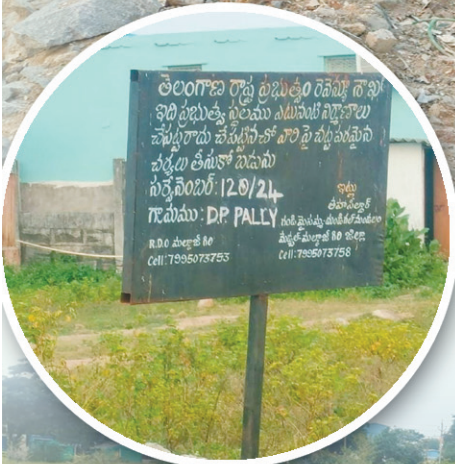
2024 నవంబర్లో మట్టినింపిన కబ్జాదారులు తాజా చిత్రం..