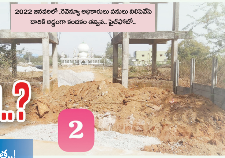
2022 జనవరిలో, రెవెన్యూ అధికారులు పనులు నిలిపివేసి దారికి అడ్డంగా కండకం తవ్విన.. ఫైల్ ఫోటో..