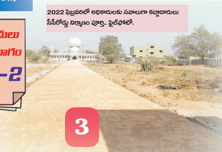
2022 ఫిబ్రవరిలో అధికారులకు సవాలుగా కబ్జాదారులు సీసీరోడ్డు నిర్మాణం పూర్తి.. ఫైల్ ఫోటో.