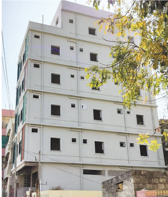
సిద్దివినాయక నగర్ లో అదనపు అంతస్తుల అక్రమ నిర్మాణం..