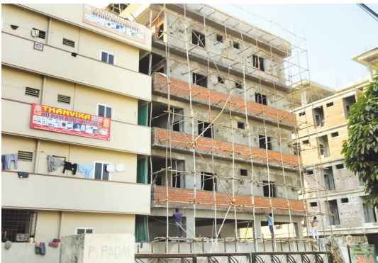
అక్రమ హాస్టల్ నిర్మాణానికి కుడివైపు శరవేగంగా పనులు.. ఎడమవైపు రంగుల భవనంలో బ్యాంక్ హాస్టల్..