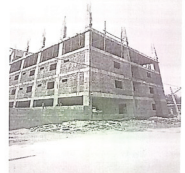
రంగులేసిన భవనానికి ఇచ్చిన స్పీకింగ్ ఆర్డర్ ఇదే..