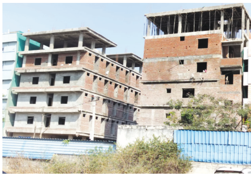
సిద్దివినాయక నగర్ లో మరో రెండు అక్రమ నిర్మాణాలు..