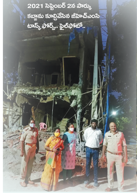
2021 సెప్టెంబర్ 2న పార్కు కబ్జాను కూల్చివేసిన జీహెచ్ఎంసీ టాన్స్ ఫోర్స్. ఫైల్ ఫోటో..