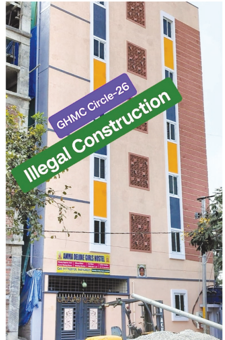
స్పీకింగ్ ఆర్డర్ ఇచ్చి.. ఐదుల లక్షల ముదుపుల అక్రమ భవనం..