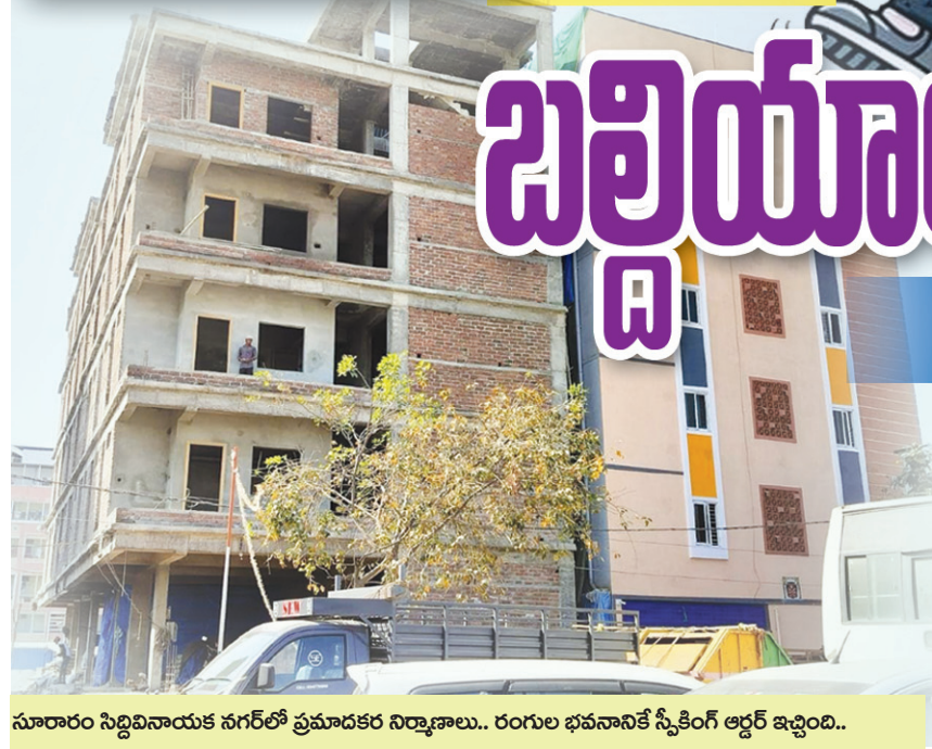
సూరారం సిద్దివినాయక నగర్ లో ప్రమాదకర నిర్మాణాలు.. రంగుల భవనానికి స్పీకింగ్ ఆర్డర్ ఇచ్చింది..