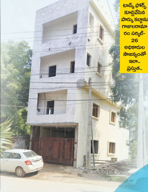
టాన్స్ ఫోర్స్ కూల్చివేసిన పార్కు కబ్జాను గాజులరామారం సర్కిల్-26 అధికారుల సౌజన్యంతో ఇలా.. ప్రస్తుత..