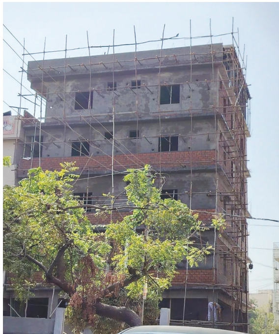
సెట్ బ్యాకులకు తిలోదకాలు, అదనపు అంతస్తుల అక్రమ నిర్మాణం..