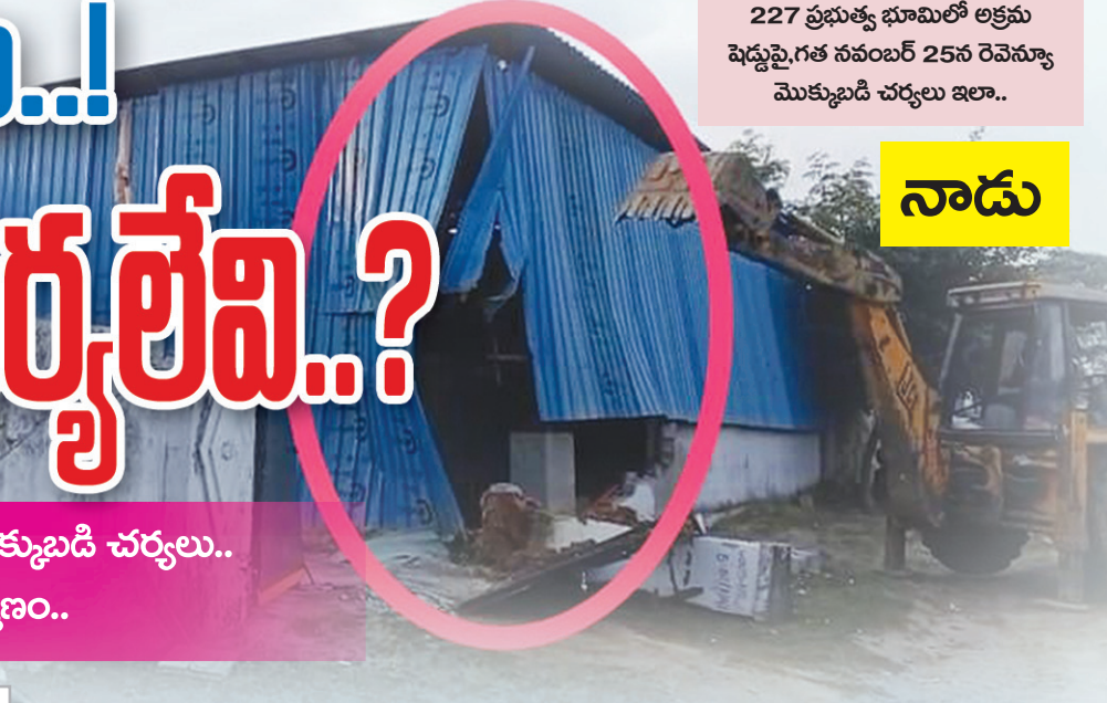
227 ప్రభుత్వ భూమిలో అక్రమ షెడ్డుపై గత నవంబర్ 25న రెవెన్యూ మొక్కుబడి చర్యలు ఇలా..