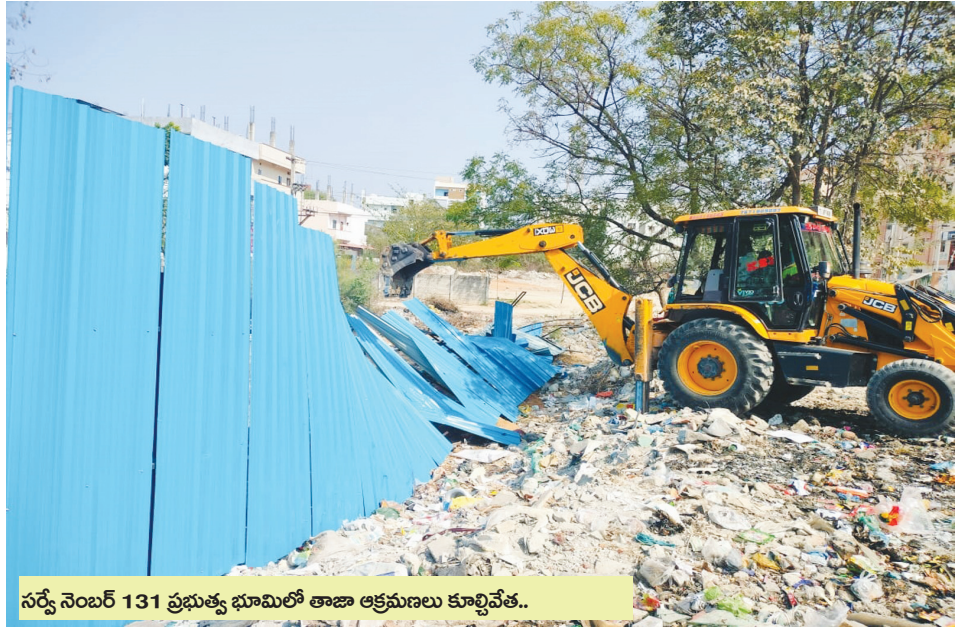
సర్వే నెంబర్ 131 ప్రభుత్వ భూమిలో తాజా ఆక్రమణలు కూల్చివేత..