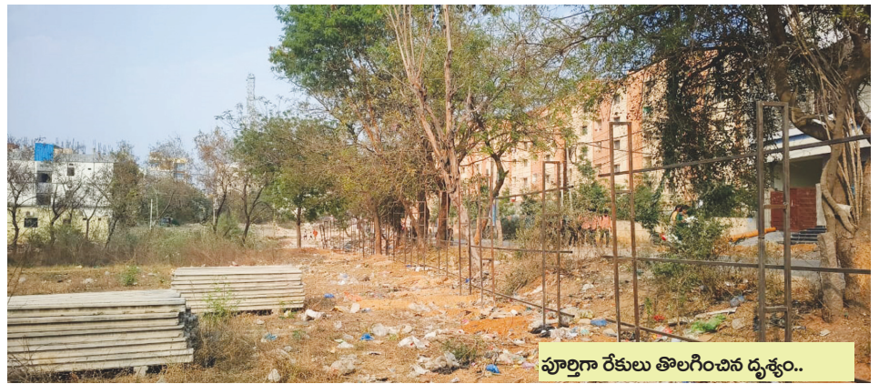
పూర్తిగా రేకులు తొలగించిన దృశ్యం..

కార్యాలయంలో రిజిస్ట్రేషన్లతో మొదలై ఏడాది చివరి వరకు రిజిస్ట్రేషన్ల ప్రక్రియ కొనసాగించారు.. ఈ వ్యవహారాన్ని "పెన్ పవర్" దినపత్రికలో వరుస కథనాలకు ఉన్నతాధికారుల ఆదేశానుసారం..! నిప్పులపై నీళ్ళు చల్లినట్లు 2024 జూన్ 28న "మేడ్చల్ జిల్లా రిజిస్ట్రార్ కి" 7 పేజీల లేఖాస్త్రంతో మమా అనిపించారు.. అయినప్పటికీ నవంబర్ నెల వరకు 227 ప్రభుత్వ భూమిలో రిజిస్ట్రేషన్లు కొనసాగటం కొన మెరుపు..