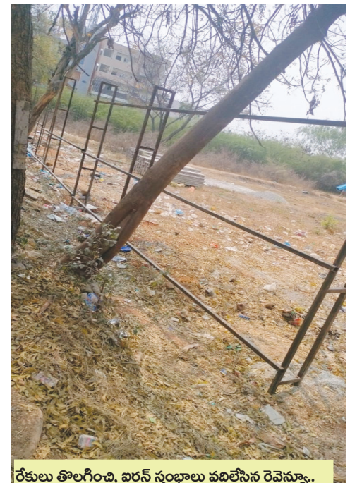
రేకులు తొలగించి, ఐర్ఎన్ స్తంభాలు వదిలిన రెవెన్యూ..