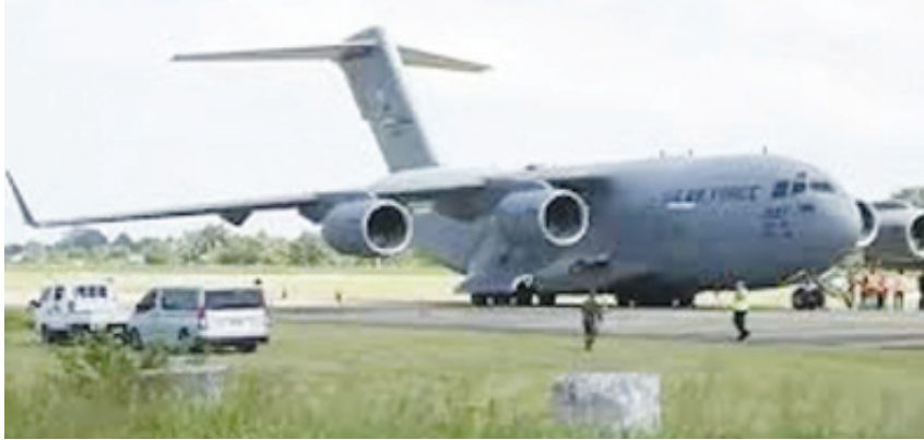
హైదరాబాద్ పెన్ పవర్: అమెరికా 487 మంది భారతీయులు ఉన్నారని భారత బహిష్కరణకు గురైన వారి తుది జాబితాలో విదేశాంగ శాఖ స్పష్టం చేసింది. అక్రమ

వలసదారుల తరలింపులో భాగంగా ఇదివరకే 104 మంది భారతీయులను అమెరికా వెనక్కి పంపింది. ఈ నేపథ్యంలో అమెరికా బహిష్కరణ తుది జాబితాలో ఎంతమంది ఉన్నారనే విషయాన్ని విదేశాంగ శాఖ వెల్లడించింది.