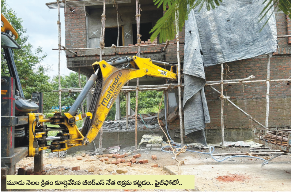
మూడు నెలల క్రితం కూల్చివేసిన బీఆర్ఎస్ నేత అక్రమ కట్టడం.. ఫైల్ ఫోటో..