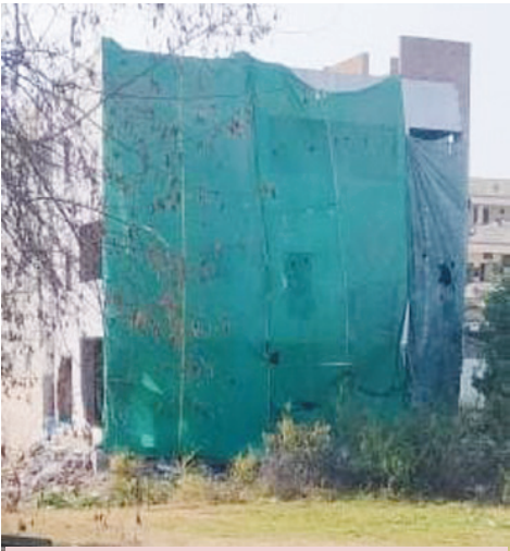
కూల్చివేసిన బీఆర్ఎస్ నేత అక్రమ నిర్మాణంలో పరదాల చాటున పనులు..