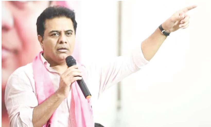
చేస్తూ వ్యంగ్యంగా స్పందించారు. ఈ సందర్భంగా కుటుంబ సర్వే నివేదిక అందుబాటులో లేదంటూ ‘ఎన్సీఆర్హెచ్ఆర్డీఐ’లో 73 పేజీల సమగ్ర ఒక ఇమేజ్ను ఆయన జత చేశారు.