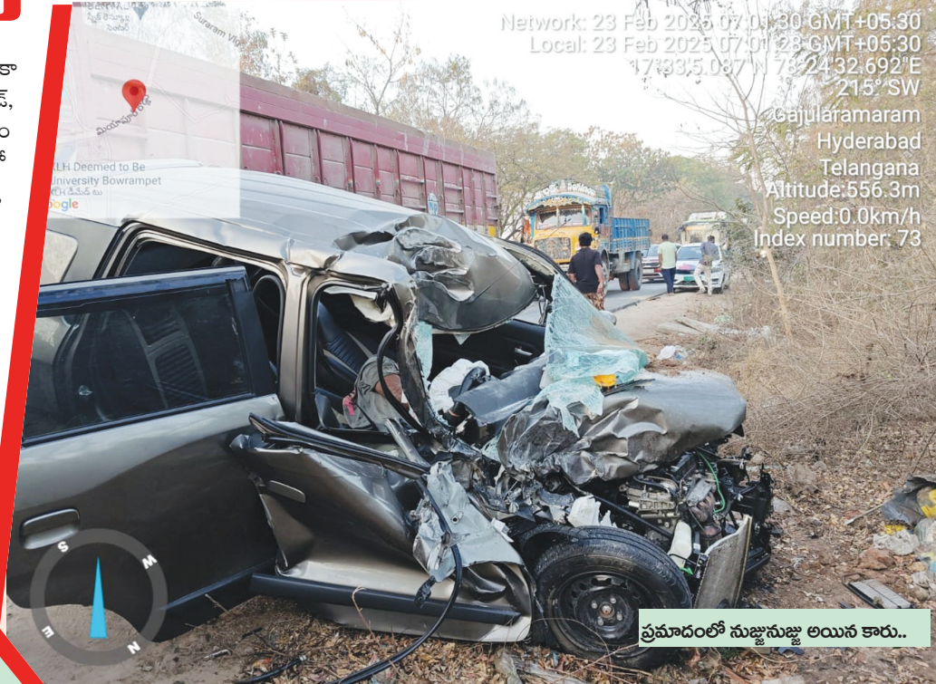
ప్రమాదంలో నుజ్జునుజ్జు అయిన కారు..