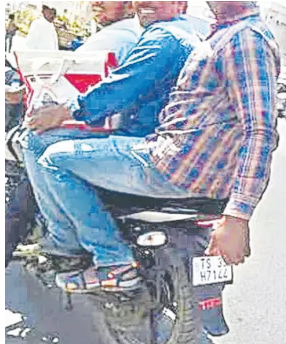
ఈ ఘటన ఇటీవల మెదక్ జిల్లా కేంద్రంలో జరిగింది. ఉద్యోగ విధుల్లో భాగంగానే ట్రాఫిక్ అధికారులతో చర్చించడంతో విద్యుత్ సరఫరాను పునరుద్ధరించినట్లు వెల్లడించారు.

హైదరాబాద్ పెన్ పవర్: ప్రభుత్వ విభాగల ఉద్యోగులైతే నిబంధనలను భేషుగా ఉల్లంఘించవచ్చునా? ఒకరి ఉల్లంఘనలను మరొకరు సహృదయంతో మన్నించాలనే రూల్స్ ఏమైనా ఉన్నాయా? ఏమో.. విద్యుత్తు శాఖలోని ఆ సిబ్బంది తీరు ఇలాగే ఉంది. ట్రాఫిక్ నిబంధనలకు విరుద్ధంగా ఒకే బైక్ పై ముగ్గురు వెళుతుండడం గమనించిన పోలీసులు నిబంధనల మేరకు జరిమానా విధించారు. దీనికి ప్రతిగా పట్టణంలోని రెండు ప్రధాన కూడళ్లలో ట్రాఫిక్ సిగ్నల్లకు విద్యుత్తు సరఫరా నిలిపివేశారు ఆ సిబ్బంది. నువ్వలా చేస్తే.. నేనిలా చేస్తా అన్నట్టుగా ఉన్న