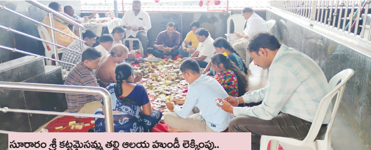
సూరారం శ్రీ కట్టమైసమ్మ తల్లి ఆలయ హుండి లెక్కింపు..