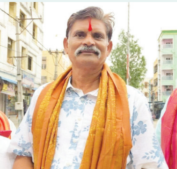
కూల్చివేసిన ఫ్లాట్లను విక్రయించిన బాలకృష్ణ, షైల్ ఫోటో..