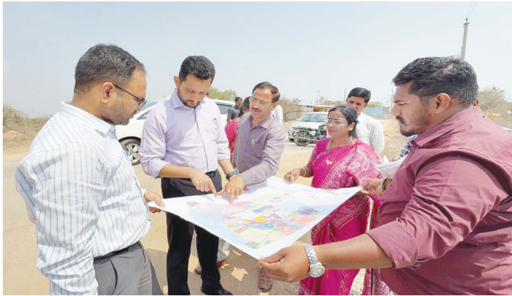
పరిశీలించిన భూముల వివరాలను కమీషనర్ కలెక్టర్, అదనపు కలెక్టర్.