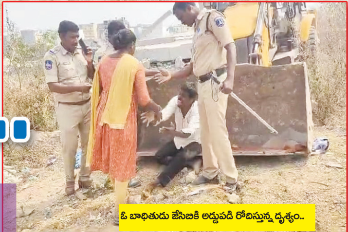
ఓ బాధితుడు జేసిబికి అడ్డుపడి రోదిస్తున్న దృశ్యం..