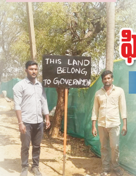
దుండిగల్ సర్వే నెంబర్ 454 ప్రభుత్వ భూమిలో బోర్డు పెట్టిన, రెవెన్యూ అధికారులు..