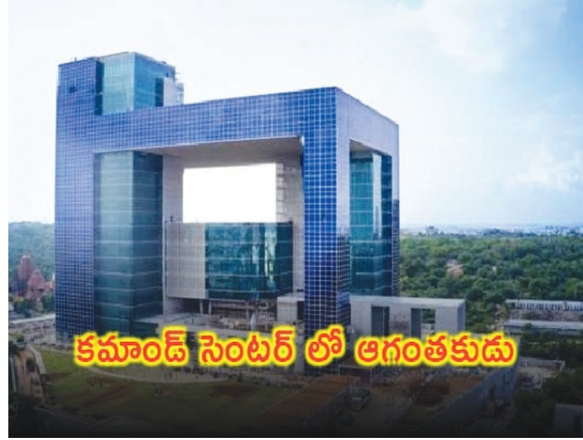
కమాండ్ సెంటర్ లో ఆగంతుకుడు

హైదరాబాద్ పెన్ పవర్: హైదరాబాద్ లోని పోలీస్ కమాండ్ కంట్రోల్ సెంటర్ లో నకిలీ ఉద్యోగి రాకపోకలు సాగించిన విషయం వెలుగులోకి వచ్చింది. టాన్స్ ఫోర్స్ కానిస్టేబుల్ ను అంటూ దర్జాగా లోపలికి వెళ్లినట్లు తెలుస్తోంది. ముఖ్యమంత్రి రేవంత్ రెడ్డి ఉన్నతాధికారులతో సమావేశం నిర్వహిస్తున్న సమయంలో ఏకంగా మూడుసార్లు రాకపోకలు సాగించడం భద్రతా వైఫల్యాన్ని బయటపెడుతోంది. తాను పోలీస్ డిపార్ట్ మెంట్ మనిషిని ఓ సాఫ్ట్ వేర్ ఇంజనీర్ ను నమ్మించేందుకు ఆగంతుకుడు ఇలా కమాండ్ కంట్రోల్ సెంటర్ లోకి రాకపోకలు సాగించినట్లు సమాచారం. అత్యంత భద్రత ఉండే కమాండ్ కంట్రోల్ సెంటర్ లోకి వెళ్లి వస్తుండడంతో అతడిని నమ్మి రూ.2.82 లక్షలు మోసపోయానని సదరు సాఫ్ట్ వేర్