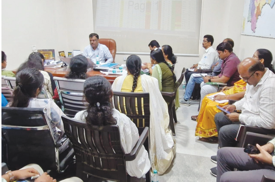
డయాబెటిక్, హైపర్ టెన్షన్, కేసులకు క్రమం తప్పకుండా మందులు..