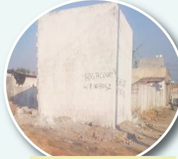
రెవెన్యూ అధికారులు కూల్చి వేయకుండా సహకరిస్తున్న ప్రత్యేక కబ్జాదారుని అక్రమ నిర్మాణం..

2023 లో గాజులరామారం దేవేందర్ నగర్ సర్వే నెంబర్ 329, అక్రమ నిర్మాణాల వ్యవహారంలో..! కుత్బుల్లాపూర్ ఆర్ఐఐ కీలకపాత్ర పోషించి ఒప్పంద అక్రమ నిర్మాణాల దండాలో.. ఒక్కో నిర్మాణానికి రూ.3 లక్షలు వసూల్ చేసి, సుమారు 70 కోట్లు గడించారని స్థానికుల ఫిర్యాదుతో విచారణ జరిపి ఆర్ఐఐ సహా ముగ్గురు విఆర్ఐఐలను అప్పటి కలెక్టర్ అమోయ్ కుమార్ ఐఎస్ సస్పెండ్ చేశారు.. ఆ తర్వాత వందలాది అక్రమ నిర్మాణాలు కూల్చివేసిన సంగతి తెలిసిందే..! ఇదిలా ఉంటే ఇప్పుడు దుండిగల్ గండిమైసమ్మ మండలం దొమ్మర పోచంపల్లి ప్రభుత్వ భూముల్లోనూ, గాజులరామారం తరహాలోనే ఒప్పంద అక్రమ నిర్మాణాల సంస్కృతి మొదలైందని పలువురు ఆరోపిస్తున్నారు..! అందుకు నిదర్శనం..! ఒప్పందాలకు అనుగుణంగా చర్యలు చేపడుతున్నారని స్థానికుల నుండి సర్వత్రా ఆరోపణలు వస్తున్నాయి.. ఈనెల (ఫిబ్రవరి) 14న ఫోటోఫూట్ చర్యల్లో భాగంగా, పాక్షిక కూల్చివేతలు చేపట్టారు.. అందులో ఓ ప్రత్యేక కబ్జాదారుని అక్రమ కట్టడాలకు, రెవెన్యూ అధికారులు చర్యలకు మినహాయింపు కల్పించడంపై పలు అనుమానాలకు తావిస్తోంది.. ఫిబ్రవరి 14న కూల్చివేసిన ఓ అక్రమ (బ్లూ కలర్) షెడ్డును కబ్జాదారులు మళ్ళీ నిర్మించినప్పటికీ అధికారుల చర్యలు శూన్యం..