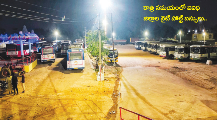
రాత్రి సమయంలో వివిధ జిల్లాల నైట్ హాల్ట్ బస్సులు..

జిల్లా బస్సులు వచ్చి వెళ్లడానికి, పార్కింగ్ చేసుకోవడానికి ఇబ్బందికరంగా తయారైందని, దీనికి తోడు లోకల్ బస్సులు రోజుకి 100 ట్రీపులు రావడం ఉదయం సాయంత్రం ట్రాఫిక్ సమయంలో ప్రజలకి అర్ద్రీసీకి ఇబ్బంది కలుగుతుందని అన్నారు.. కావున తక్షణమే బస్ డిపో స్థలం కోసం పక్కనే ఉన్న హెచ్ఎంటి ఖాళీ స్థలం సర్వే నెంబర్ 50లో 10 ఎకరాల స్థలం కేటాయించాలని కలెక్టర్ కి లేఖ