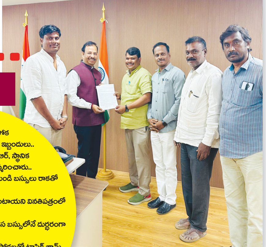
సజ్జనార్‌ను కలిసి వినతిపత్రం అందజేస్తున్న ఆకుల సతీష్ టీమ్..