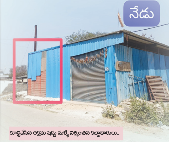
ఫిబ్రవరి 14న అక్రమ షెడ్డును కూల్చివేస్తున్న రెవెన్యూ సిబ్బంది..