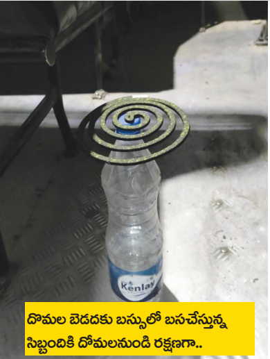
దొమల బెడదకు బస్సులో బస్చేస్తున్న సిబ్బందికి దోమలనుండి రక్షణగా..