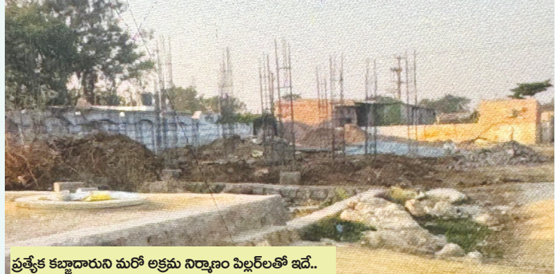
ప్రత్యేక కబ్జాదారుని మరో అక్రమ నిర్మాణం పిల్లర్లతో ఇదే..