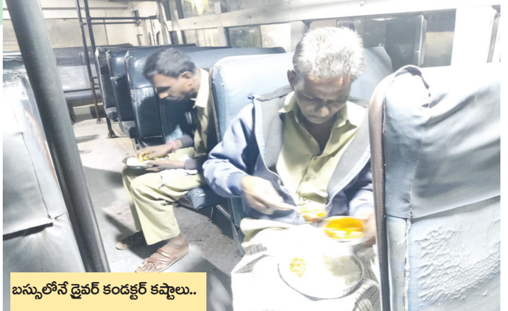
బస్సులోనే డ్రైవర్ కండక్టర్ కష్టాలు..