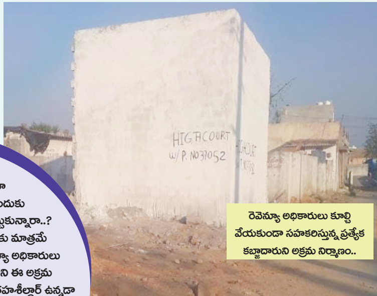
రెవెన్యూ అధికారులు కూల్చి వేయకుండా సహకరిస్తున్న ప్రత్యేక కబ్జాదారుని అక్రమ నిర్మాణం..