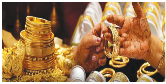
కొనడం ఆనవాయితీ. కానీ పెరిగిన గోల్డ్ రేట్లతో వధువు తల్లిదండ్రులు హడలెత్తిపోతున్నారు.

విపరీతంగా పెరగడంతో సామాన్యులు, మధ్య తరగతి జనం బంగారం కొనడానికి నానా తిప్పలు పడుతున్నారు. జనవరి 30న మాఘమాసం ప్రారంభమైంది. ఫిబ్రవరి 2 నుంచి మార్చి 26 వరకు మంచి ముహూర్తాలు ఉన్నాయి. దీంతో లక్షలాది పెళ్లిళ్లు, గృహప్రవేశాలు జరగనున్నాయి. తెలుగిండ్లలో బంగారం లేకుండా పెళ్లిళ్లు జరగవనే సంగతి తెలియంది కాదు. ఆయా కుటుంబాలు తాహతును బట్టి పెళ్లి కూతుర్లకు, అడపడుమలకు తులాల కొద్దీ బంగారు ఆభరణాలు