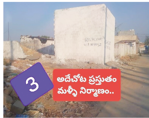
3 అదే చోట ప్రస్తుతం మళ్ళీ నిర్మాణం..