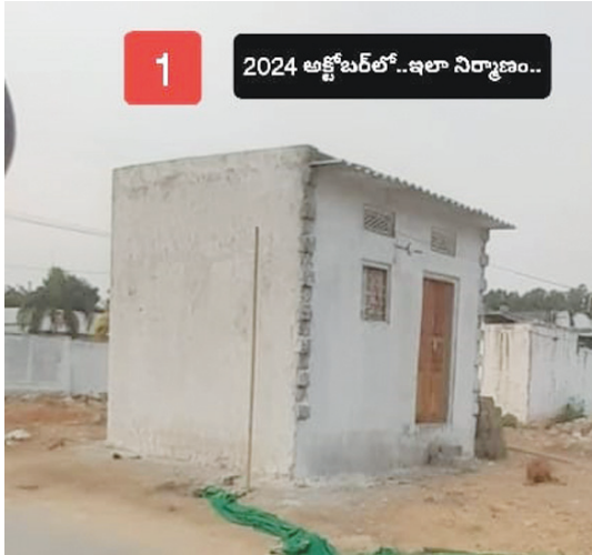
1 2024 అక్టోబర్ లో..ఇలా నిర్మాణం..