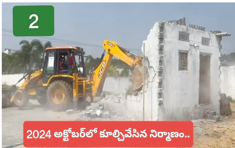
2 2024 అక్టోబర్ లో కూల్చివేసిన నిర్మాణం..