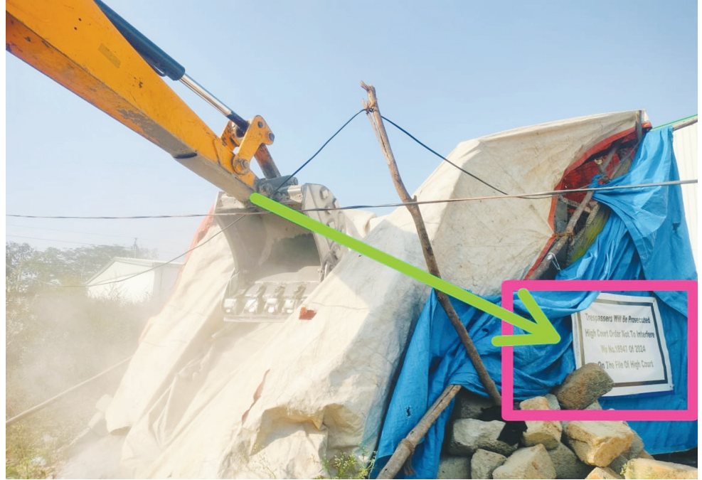
ఈనెల 1న హైకోర్టు ఆర్డర్ ఉందని ఫైల్ చేసిన ఉన్నప్పటికీ రెవెన్యూ చర్యలు..ఫైల్ ఫోటో..