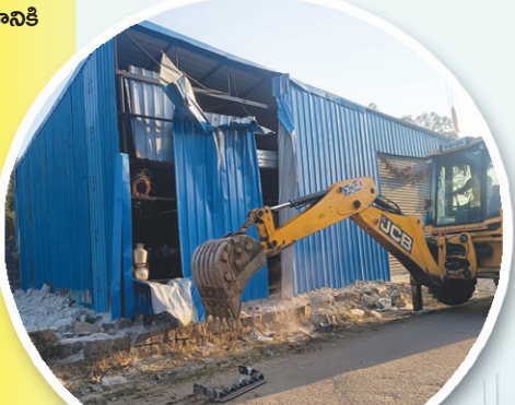
అక్రమ షెడ్డుపై రెవెన్యూ కూల్చివేతలు..

డి.పోచంపల్లి సర్వే నెం.120 ప్రభుత్వ భూమిలో విచ్చలవిడిగా అక్రమ కట్టడాలు..