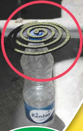
బస్సులో దోమల బెడదతో.. మస్కితో కాయిల్స్..