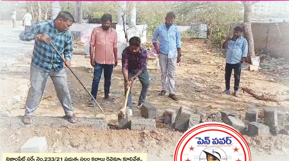
నిజాంపేట్ సర్వే నెం.233/21 ప్రభుత్వ స్థలం కబ్జా రెవెన్యూ కూల్చివేత..