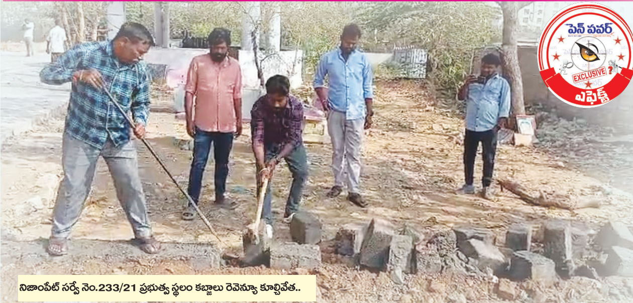
నిజాంపేట్ సర్వే నెం.233/21 ప్రభుత్వ స్థలం కబ్జాలు రెవెన్యూ కూల్చివేత..