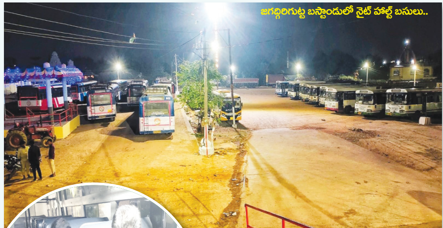
జగద్ధిగుట్ట బస్టాండులో నైట్ హాల్ట్ బస్సులు..