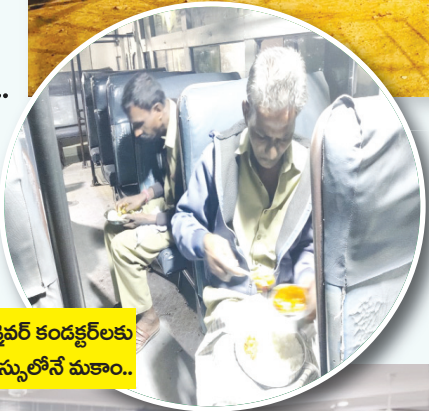
ఆర్టీసీ బస్సు డ్రైవర్ కండక్టర్లకు వసతులు లేక బస్సులోనే మకాం..