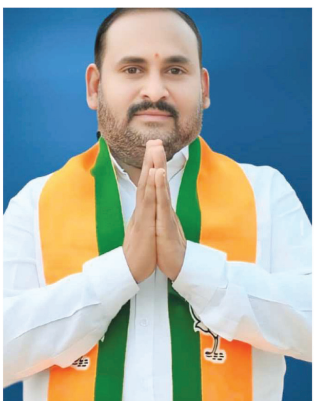
గిద్దలూరు పెన్ పవర్ ఫిబ్రవరి 16

కోమరోలు మండలం అలసందల పల్లె లో జి.బి. యెస్ వైరస్ కలకలం జిల్లా లోనే మొదటి కేసుగా పరిగణన గుంటూరు లోని జి.బి యెస్ హాస్పిటల్ లో మహిళకు చికిత్స లక్షణాలు కనిపిస్తే వైద్యులను సంప్రదించాలి బిజెపి నాయకులు అప్పిశెట్టి