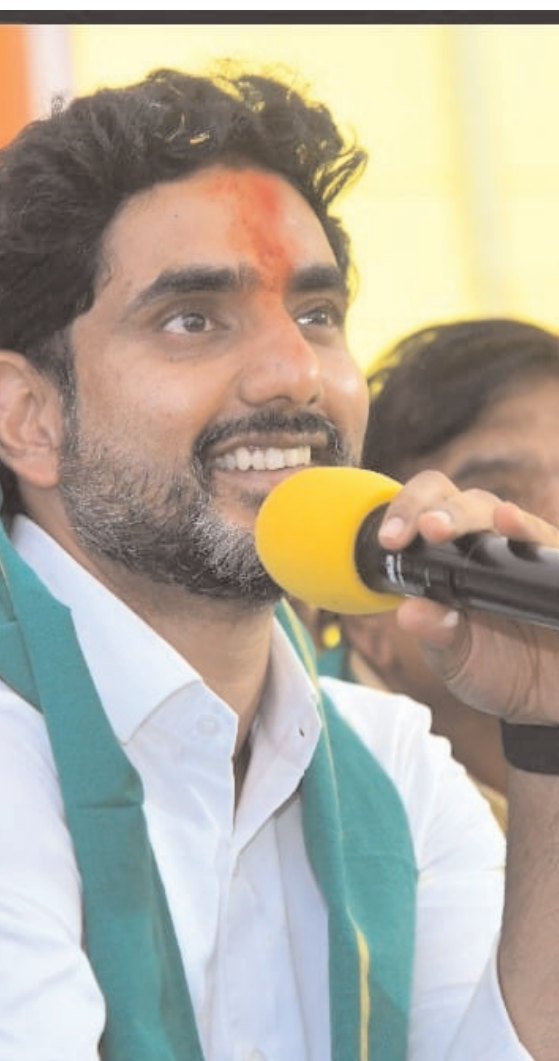
కార్యకర్తలతో సమావేశం అనంతరం మంత్రి నారా లోకేశ్ తిరువతి నగర కార్పొరేటర్లతో సమావేశం అయ్యారు. వార్డుల అభివృద్ధికి ప్రభుత్వం నుంచి హార్ది సహకారం అందిస్తామని చెప్పారు.

నేను పాదయాత్ర చేసినప్పుడు.. అన్నా నేను కష్టపడ్డాను.. నన్ను గుర్తించడం లేదని చాలా మంది నాతో చెప్పారు. సీనియర్లు, జూనియర్లు సమానంగా గౌరవిస్తూ, పనిచేసే వారిని ప్రోత్సహిస్తూ, పార్టీ లేకపోతే మనం ఎవరూ లేము అని గుర్తుంచుకోవాలి. ఇవాళ మనకు సమాజంలో గౌరవం లభిస్తోందంటే అందుకు కారణ తెలుగు దేశం పార్టీనే. కార్యకర్తల సమస్యలు తెలుసుకుని, వారికి అండగా నిలబడాలి ఎన్నికల్లో గెలిచాం, తిరుగులేదనే భోరణి సరికాదు. నిత్యం ప్రజల్లో ఉండాలి. మంగళగిరిలో నేను 91వేల మెజార్టీతో గెలిచా. నాకు ఎంత పని ఒత్తిడి ఉన్నా మంగళగిరి ప్రజలకు నిత్యం అందుబాటులో ఉంటున్నా బాధ్యత పెరిగింది. కార్యకర్తల సమస్యలు తెలుసుకుని, వారికి అండగా నిలబడాలి. అలకలు మానుకుని నాయకులు సమీక్షగా పనిచేయాలి. గత ఐదేళ్లలో మనం అనేక కష్టాలు ఎదుర్కొన్నాం. అక్రమ కేసులు పెట్టారు, లాఠీఛార్జి చేశారు. అవన్నీ మర్చిపోకూడదు. వైసీపీ దుష్ప్రచారాలను తిప్పికొట్టాలి పార్టీ ఏ కార్యక్రమం పిలుపునిచ్చినా కలిసికట్టుగా పనిచేయాలి. ప్రజల్లోకి తీసుకెళ్లాలి. గ్రూప్ రాజకీయాలకు దూరంగా ఉండాలి. వైసీపీ నేతలు రెడ్ బుక్ గురించి మాట్లాడుతున్నారు. వైసీపీ నాయకులు ప్రజలను, మనల్ని ఇబ్బంది పెట్టారు. తప్పుచేసిన వారిని వద్దటి ప్రకారం చట్టపరిధిలో శిక్షిస్తాం. వైసీపీ దుష్ప్రచారాలను తిప్పికొట్టాలి కార్పొరేటర్ల తో సమావేశమైన నారా లోకేశ్