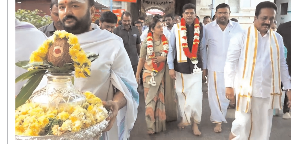
శ్రీ కాళహస్తి - పెన్ పవర్, ఫిబ్రవరి 19. ప్రముఖ పుణ్యక్షేత్రమైన శ్రీకాళహస్తిశ్వరస్వామి వారి దేవస్థానానికి కేంద్ర గ్రామీణ అభివృద్ధి, కమ్యూనికేషన్ మంత్రి డాక్టర్ పెమ్మసాని చంద్రశేఖర్ కుటుంబ సభ్యులతో విచ్చేశారు. వారికి శ్రీకాళహస్తి నియోజకవర్గం