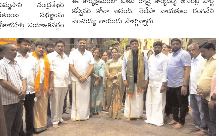
కేంద్రమంత్రి డాక్టర్ పెమ్మసాని చంద్రశేఖర్ కుటుంబ సభ్యులను శ్రీకాళహస్తి నియోజకవర్గం