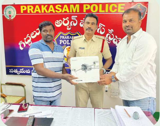
గిద్దలూరు పెన్ పవర్ ఫిబ్రవరి 16

గిద్దలూరు పోలీస్ శాఖకు "డ్రోన్ కెమెరా" బహుకరించిన టీడీపీ నాయకులు చంటి - బిలీవ్