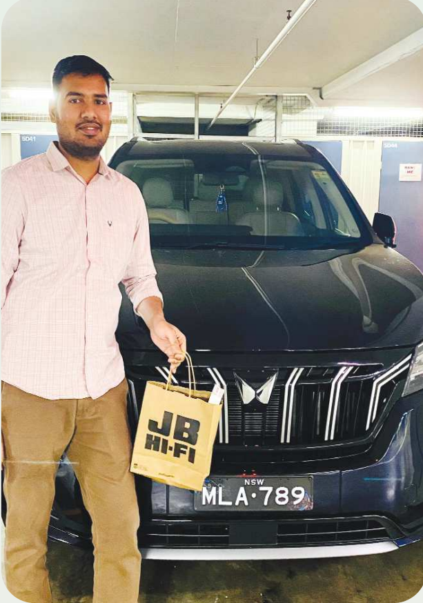
స్టాఫ్ రిపోర్టర్ ఒంగోలు, పెన్ పవర్ ఫిబ్రవరి 16

ఎమ్మెల్యే ఏలూరి సొంబశివరావు పై అభిమానం ఎల్లలు దాటింది. మార్కెట్ తెలుగుదేశం పార్టీ సీనియర్ నాయకులు కాకేలు వెంకటేశ్వర్లు కుమారుడు హరీష్ ఆస్ట్రేలియాలో ఉద్యోగం చేస్తున్నారు. సొంబన్న పై అభిమానంతో తాను నూతనంగా కొనుగోలు చేసిన ఎక్స్ యు వి 700 కారుపై ఎమ్మెల్యే 789 అని స్టికర్లుంటే చేయించారు. రాజకీయాల్లోకి వచ్చిన తర్వాత ఎమ్మెల్యే ఏలూరి సొంబశివరావు పర్యటన నియోజకవర్గంలో 789 కిలోమీటర్లు పాదయాత్ర చేసి ప్రజా సమస్యలను తెలుసుకున్నారు. నాటి నుంచి ఎమ్మెల్యే ఏలూరి వాహన శ్రేణికి 789 నెంబర్ ఆనవాలు తీ. అయితే హరీష్ సొంబన్న పై ఇష్టంతో తన కారుకు 789 నెంబర్ తీసుకొని అభిమానాన్ని చాటుకున్నారు.