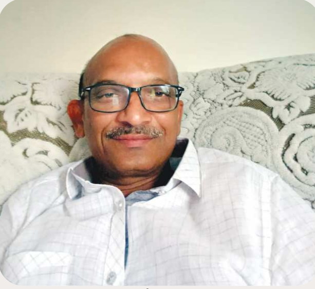
స్టాఫ్ రిపోర్టర్ ఒంగోలు, పెన్ పవర్ ఫిబ్రవరి 16