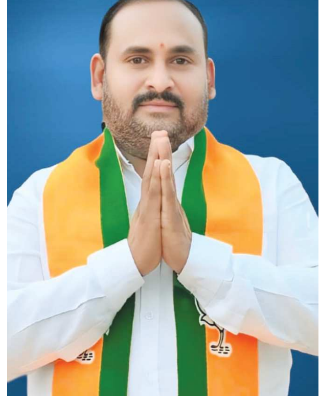
గిట్లూరు పెన్ పవర్ ఫిబ్రవరి 16

కోమరోలు మండలం అలసందల పల్లె లో జి.బి. యెస్ వైరస్ కలకలం జిల్లా లోనే మొదటి కేసుగా పరిగణన గుంటూరు లోని జి.జి యెస్ హాస్పిటల్ లో మహిళకు చికిత్స లక్షణాలు కనిపిస్తే వైద్యులను సంప్రదించాలి బిజెపి నాయకులు అప్పీవెల్లి