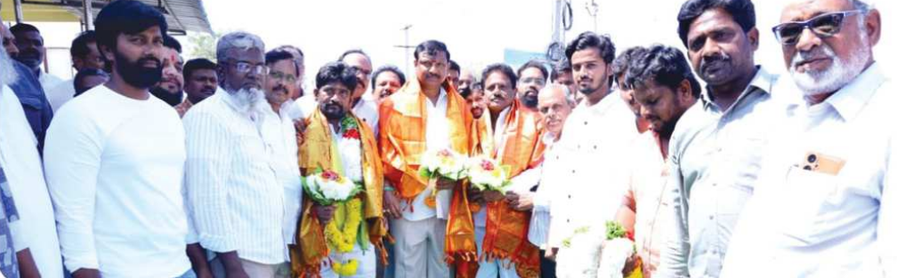
పొదిలి, పెన్ పవర్ ఫిబ్రవరి 16