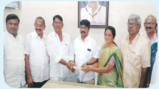
పెన్ పవర్, పామర, ఫిబ్రవరి 16