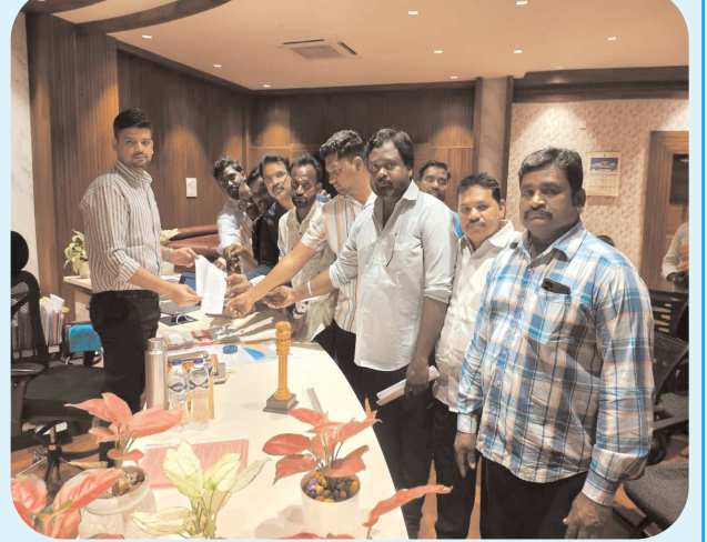
చీరాల, పెన్ పవర్, ఫిబ్రవరి 15