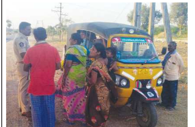
పెన్ పవర్ చిలకలూరిపేట ఫిబ్రవరి 15: