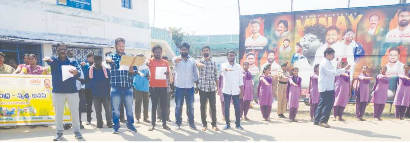
వేటపాలెం, పెన్ పవర్, ఫిబ్రవరి 15