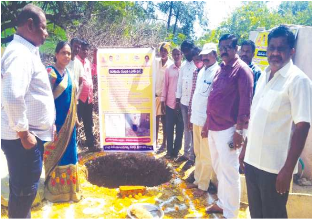
కొమరోలు పెన్ పవర్ ఫిబ్రవరి 15

ఒకే రోజు 343 ఇంకుడు గుంతల ఏర్పాటుకు చర్యలు తీసుకున్నాం- ఎంపీడీవో మస్తాన్ వలి.