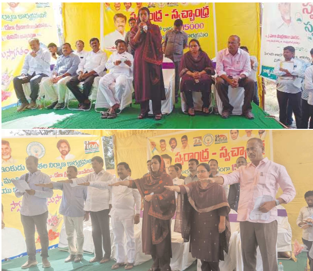
స్టాఫ్ రిపోర్టర్ ఒంగోలు, పెన్ పవర్ ఫిబ్రవరి 15