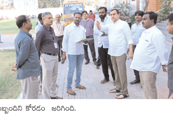
సిబ్బందిని కోరడం జరిగింది.