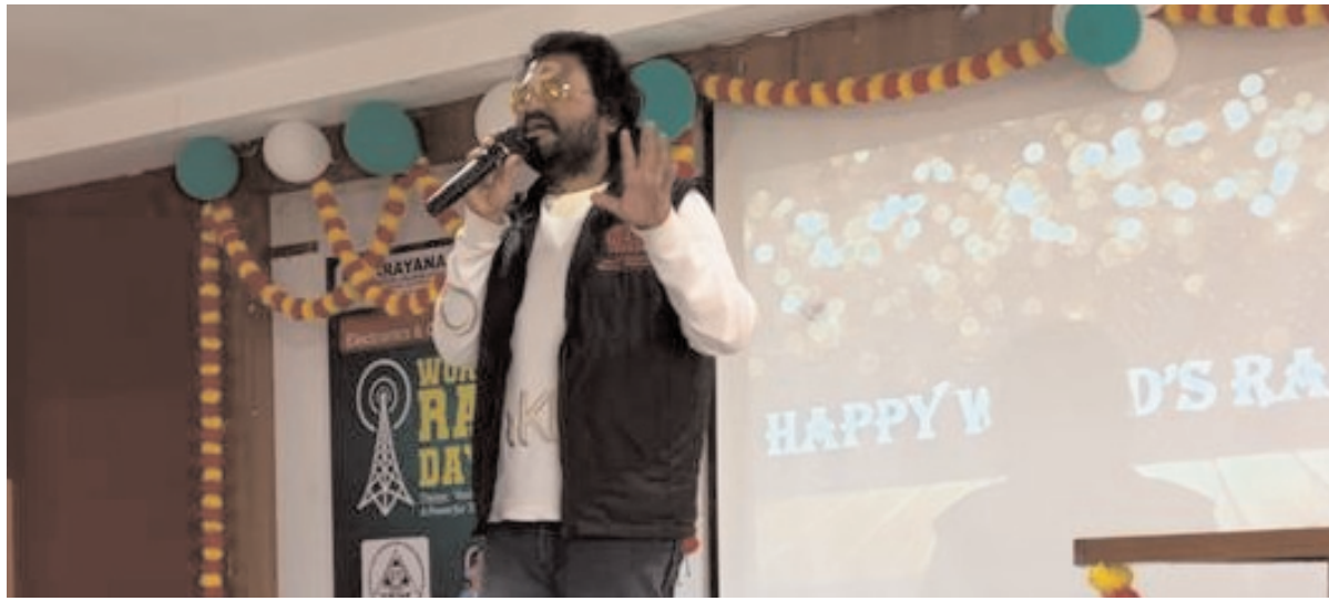
తెలియజేసారు. ఈ కార్యక్రమంలో వివిధ విభాగాధిపతులు, కమెంట్ మరియు అధ్యాపకతర సిబ్బంది పాల్గొన్నారు.

బోస్ రిపోర్ట్ గూడూరు, పెన్ పవర్ 14: గూడూరు లోని నారాయణ ఇంజనీరింగ్ కళాశాల లో ప్రపంచ రేడియో దినోత్సవం నిర్వహించారు.