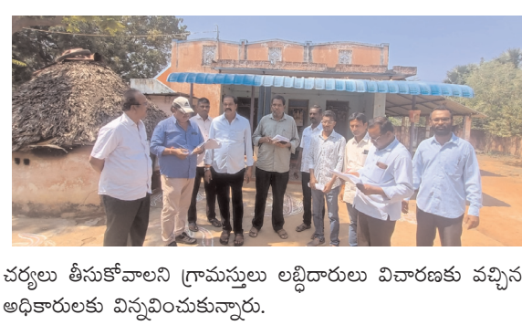
చర్యలు తీసుకోవాలని గ్రామస్తులు లబ్ధిదారులు విచారణకు వచ్చిన అధికారులకు విన్నవించుకున్నారు.

స్వాహా చేసినట్లు లబ్ధిదారులు తెలిపారు. విచారణ బృందం వివరణ మొత్తం తీసుకుని టిడిపి తెలుపుతామని వెళ్లారు. గత ప్రభుత్వ మాజీ ఎమ్మెల్యే ప్రొద్దులతో అధికారులు అవకతవకలకు పాల్పడినట్లు లబ్ధిదారులు తెలుపడంతో అధికారులు ఆ దిశగా విచారణ సాగిస్తున్నారు. ఎంపెరు గ్రామంలో జరిగిన హౌసింగ్ అవకతవకలపై విచారణకు అధికారులు రావడంతో గత ప్రభుత్వం హయాంలో అవకతవకలకు పాల్పడిన అధికారుల్లో వణుకు మొదలైంది. హౌసింగ్ లో నిధులు స్వాహా చేసిన నాయకులపై అందుకు సహకరించిన అధికారులపై కలెక్టర్, తగు కఠినమైన