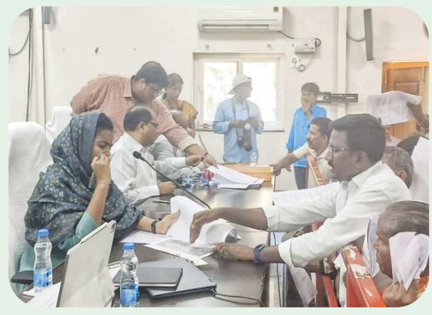
బేస్తవారిపేట, పేన్ పవర్ ఫిబ్రవరి 24:

కలెక్టర్ గ్రీవెన్స్ సెల్ లో ఫిర్యాదు చేసిన క్రైస్తవ యువత