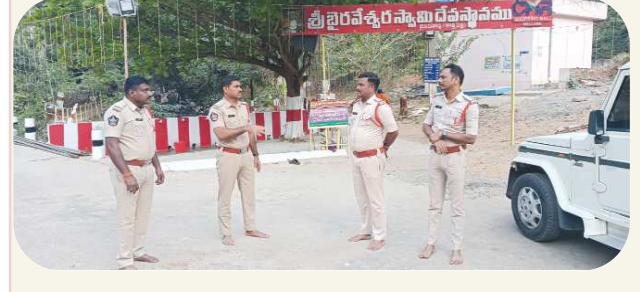
పెన్ పవర్, పామూరు, ఫిబ్రవరి 24.