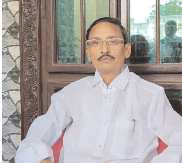
పెన్ పవర్ చిలకలూరిపేట ఫిబ్రవరి 24: