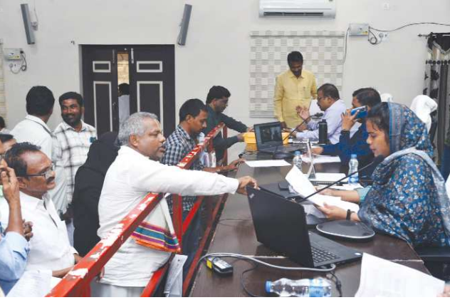
స్టాఫ్ రిపోర్టర్ ఒంగోలు, పెన్ పవర్ ఫిబ్రవరి 24

ప్రజా సమస్యల పరిష్కార వేదికలో వచ్చే అర్జీల పరిష్కారంపై అధికారులు ప్రత్యేక శ్రద్ధ పెట్టి బాధ్యతతో పని చేయాలని జిల్లా కలెక్టర్ పి. తమిమ్ అన్నారు. సోమవారం ఒంగోలు కలెక్టరేట్