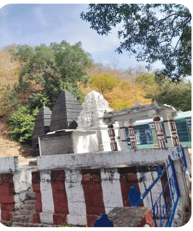
గిద్దలూరు పేన్ పవర్ ఫిబ్రవరి 24

ఈ నెల 26 బుధవారం నుండి గిద్దలూరు మండలము పలుపల వీడు బైరవేశ్వర స్వామి క్షేత్రంలో మహాశివరాత్రి పర్వదిన పురస్కరించుకుని భక్తులకు ఏర్పాటు పూర్వయ్యాయని ఆలయ కమిటీ