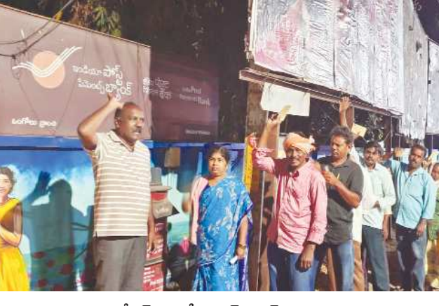
కార్పొరేషన్ ఒంగోలు, పేన్ పవర్ ఫిబ్రవరి 23

ఆప్కాస్ వల్ల గత నాలుగు సంవత్సరాలు మున్సిపల్ కార్మికులు ఊపిరి పీల్చుకున్నారని దళారీ వ్యవస్థ లేకుండా ప్రతి నెల మునిసిపల్ కార్మికులకు జీతం ఒకటి రెండు తేదీలో కార్మికుల అకౌంట్ లో జమ అవుతున్నాయని ఇంత పారదర్శకంగా ఉన్న ఆప్కాస్ ను కాదని ప్రైవేట్