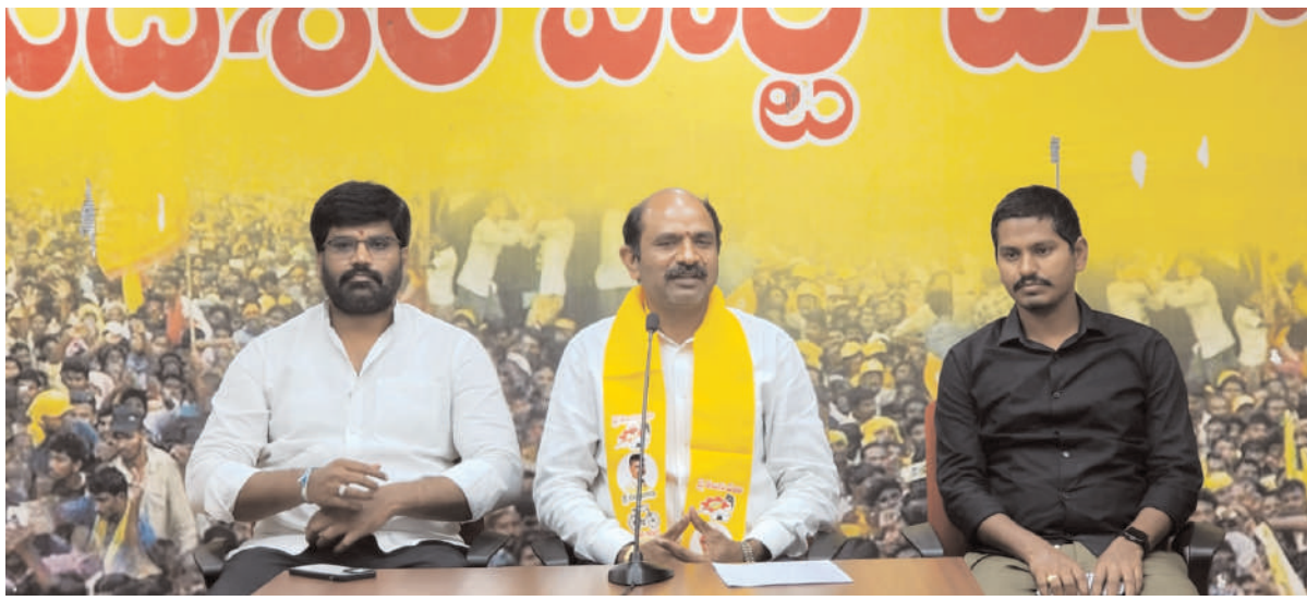
లేకపోతున్నారు. రాష్ట్రానికి పెట్టబడులు రా కుండా అడ్డుకోవాలని ప్రత్యేక వ్యూహంతో జగన్ ముందుకు వెళ్తున్నట్లు తెలుస్తుంది.

విశాఖ డిజింజం, పెన్ పవర్, ఫిబ్రవరి 23 : ఆదివారం జిల్లా తెలుగుదేశం పార్టీ కార్యాలయం లో జరిగిన విలేజ్ కలల సమావేశంలో ఎం.పీ కలిశెట్టి అప్పలనాయుడు కామెంట్స్ కూటమి ఉత్తరాంధ్ర ఉపాధ్యాయ ఎమ్మెల్సీ ఎన్నికలో పా కలపాటి రఘువర్మ కు మద్దతు ఇచ్చింది. రఘు వర్మ గెలుపుకు కూటమి పార్టీలు కృషి చేస్తున్నాయి. మంచి వ్యక్తి రఘువర్మ కు ఉపా ధ్యాయులు మద్దతు ఇవ్వాలి. జగన్మోహన్ రెడ్డి అసెంబ్లీ కి వస్తారని ప్రకటన చేయడాన్ని స్వాగ తిస్తున్నా ము. అసెంబ్లీ కి వెళ్లి ప్రజా సమస్యలు పై జగన్ ను ప్రతిపక్షం కోసం జగన్ అసెంబ్లీ కి వెళ్ళే ప్రజలు హర్షించారు. గత ఐదు సంవత్సరాలలో ప్రకృతి వనరులను నాశనం చేసి నందుకు జగన్, వై సీపీ ఎమ్మెల్యే లు అసెంబ్లీ లో ప్రజలకు క్షేమాపన చెప్పారని. జగన్మోహన్ రెడ్డి, పెద్దిరెడ్డి దోపిడీలపై అసెంబ్లీ లో చర్చ జరగాలి. గత ఐదే జ్ఞలో వైసీపీ చేయని పనులను కూటమి ప్రభు త్వం చేస్తుంది. ది.గడిచిన ఐదేళ్లలో పోల వరం ప్రాజెక్ట్ ను నిర్మి ర్యం చేశారు. కూటమి ప్రభు త్వానికి వస్తున్న పేరు ప్రతిష్టలు చూసి వైసీపీ నాయకులు ఓర్వ