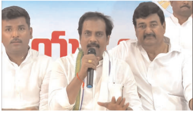
మంది ఉన్నారు. జగన్ సేన అన్ని సేనల కంటే స్ట్రాంగ్ గా ఉంది.

విశాఖ దక్షిణం, పెన్ పవర్, ఫిబ్రవరి 23 : ఉత్తరాంధ్ర సమస్యల కర్త గా నియమించిన వైఎస్ జగన్ కు ధన్యవాదాలు. చంద్రన్న పగ, చంద్రన్న దగ అనే పథకాలను అమలు చేస్తున్నారు. కూటమి ప్రభుత్వం పజల్లో విశ్వాసం కోల్పోయింది. అన్ని వర్గాల ప్రజలను చంద్రబాబు మోసం చేశారు. ఉత్తరాంధ్ర ఉద్యమాల పురిటి గడ్డ. ఉత్తరాంధ్ర అభివృద్ధి కోసం విశాఖను పరిపాలన రాజధానిగా చేయాలని చూశారు. చెప్పింది చేసే వైజం వైఎస్ జగన్. డి.గ్రూప్ 2 అభ్యర్థులను మోసం చేశారు. ప్రజల పక్షాన వైఎస్ రీపీ నిలబడుతుంది. పేదల పక్ష పాతి వైఎస్ జగన్. లక్ష 20 వేల కోట్లు అప్పు చేసి చంద్రబాబు ఏమి చేశారో తెలియదు. రాజకీయ పార్టీలో వల నలు సాధారణం. జగన్ కోసం ప్రాణాలు ఇచ్చే వారు కోట్లాది