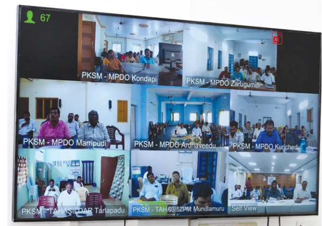
స్టాఫ్ రిపోర్టర్ ఒంగోలు, పెన్ పవర్ ఫిబ్రవరి 24