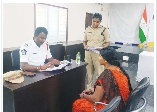
స్టాఫ్ రిపోర్టర్ ఒంగోలు, పెన్ పవర్ ఫిబ్రవరి 24