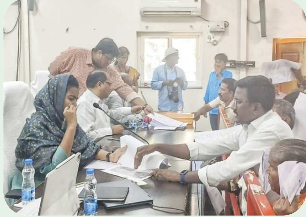
బేస్తవారిపేట, పెన్ పవర్ ఫిబ్రవరి 24:

కలెక్టర్ గ్రీవెన్స్ సెల్ లో ఫిర్యాదు చేసిన క్రైస్తవ యువత