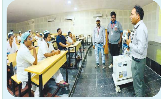
కార్పొరేషన్ ఒంగోలు, పెన్ పవర్ ఫిబ్రవరి 23