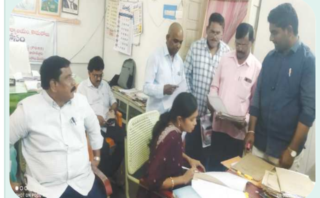
కొమరోలు పెన్ పవర్ ఫిబ్రవరి 24