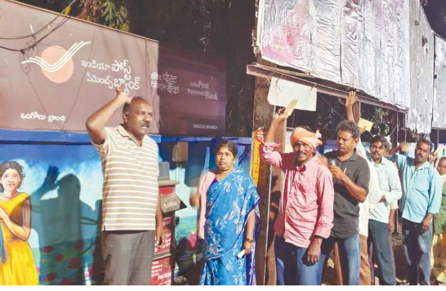
కార్పొరేషన్ ఒంగోలు, పెన్ పవర్ ఫిబ్రవరి 23

ఆప్కాన్ వల్ల గత నాలుగు సంవత్సరాలు మున్సిపల్ కార్మికులు ఊపిరి పీల్చుకున్నారని దళాల్ వ్యవస్థ లేకుండా ప్రతి నెల మునిసిపల్ కార్మికులకు జీతం ఒకటి రెండు తేదీలలో కార్మికుల ఆకౌంట్ లో జమ అవుతున్నాయని ఇంత పారదర్శకంగా ఉన్న ఆప్కాన్ ను కాదని ప్రైవేట్