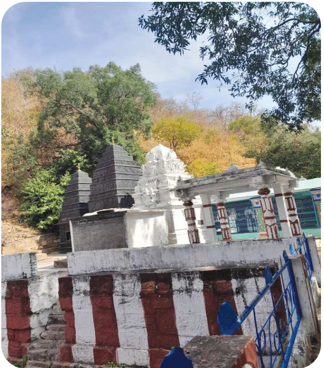
గిద్దలూరు పెన్ పవర్ ఫిబ్రవరి 24

ఈ నెల 26 బుధవారం నుండి గిద్దలూరు మండలము పలుపల వీడు బైరవేశ్వర స్వామి క్షేత్రంలో మహాశివరాత్రి పర్వదిన పురస్కరించుకుని భక్తులకు ఏర్పాటు పూర్వాయాసిన ఆలయ కమిటీ