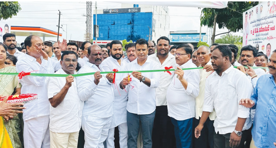
ప్రభుత్వ స్థలంలో అక్రమ సీసీరోడ్డుకు నేతల ప్రారంభోత్సవాలు.. ఫైల్ ఫోటో