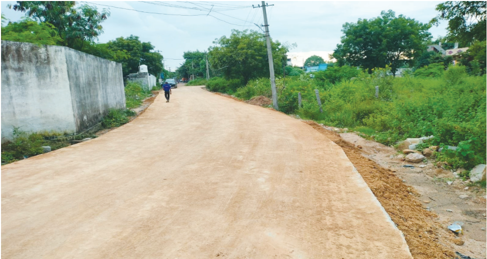
సర్వే నెంబర్ 227 ప్రభుత్వ భూమిలో అక్రమ సీసీరోడ్డుకు.. అధికారిక నిధులు.. ఫైల్ ఫోటో..

- మొదటి పేజీ తరువాయి మేడ్చల్ మల్లజిగిరి జిల్లా దుండిగల్ గండిమైసమ్మ మండలం, బహుదూర్పల్లి సర్వే నెంబర్ 227 ప్రభుత్వ భూమి 353.35 ఎకరాలు పోరంబోకు భూమిగా, నిర్ధారణతో నోటీసులు జారీచేసిన రెవెన్యూ యంత్రాంగం నిర్ణయం వహిస్తుందా..? సుమారు రూ.2 వేలకోట్లు పైచిలుకు విలువైన ప్రభుత్వ ఆస్తులపై