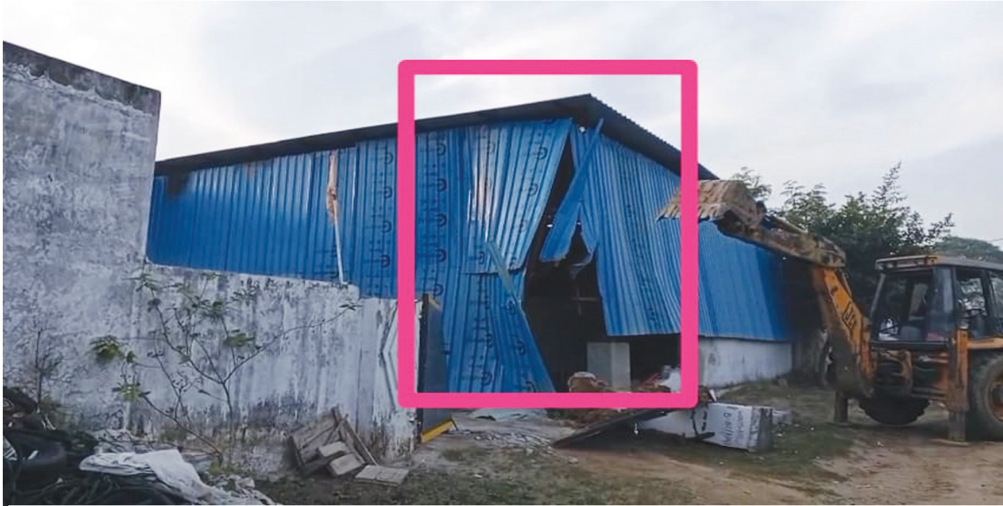
2024 నవంబర్ 25న తహశీల్దార్ నోటీసులు ఇచ్చిన షెడ్డుపై “ఫోటోఘాట్” కూల్చివేతలు..