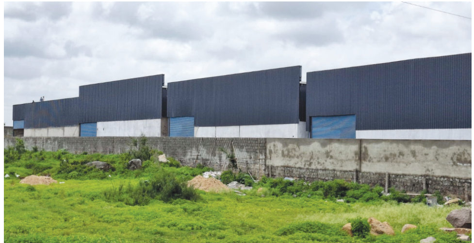
కూల్చివేసిన అక్రమ షెడ్లు, కమిషనర్, టిపిఎస్ సహకారంతో మళ్ళీ నిర్మాణం..