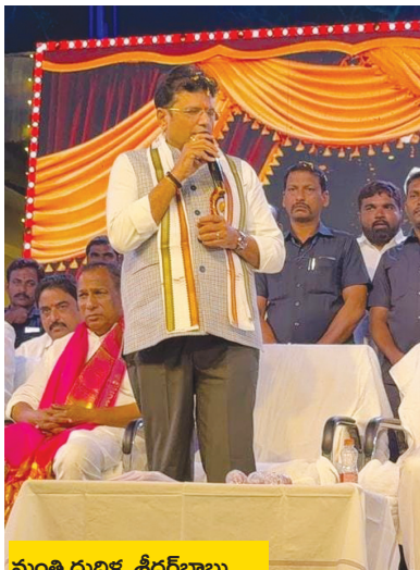
మంత్రి దుద్దిళ్ళ శ్రీధర్ బాబు..