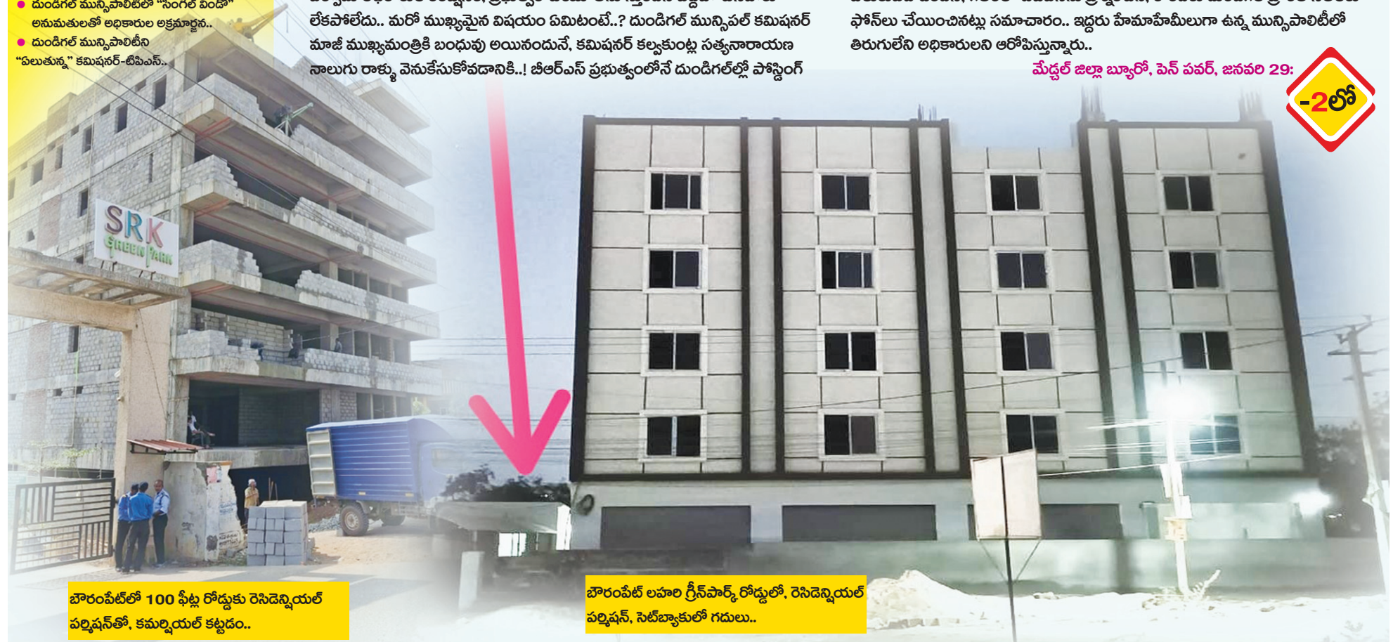
బొరంపేట్ లో 100 ఫీట్ల రోడ్డుకు రెసిడెన్షియల్ పర్మిషన్ తో, కమర్షియల్ కట్టడం..