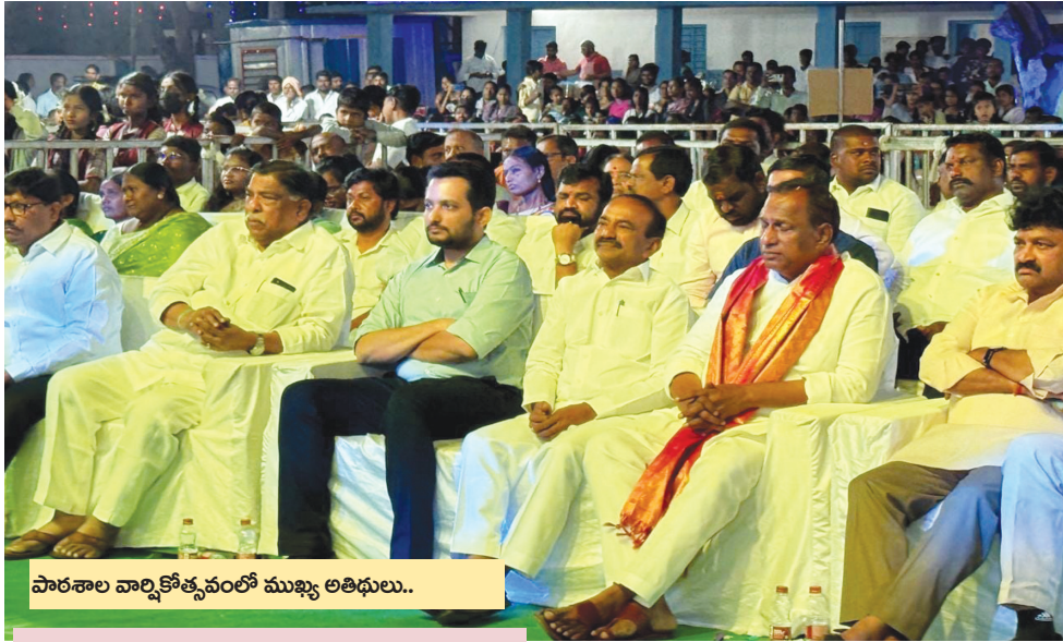
పాఠశాల వార్షికోత్సవంలో ముఖ్య అతిథులు..