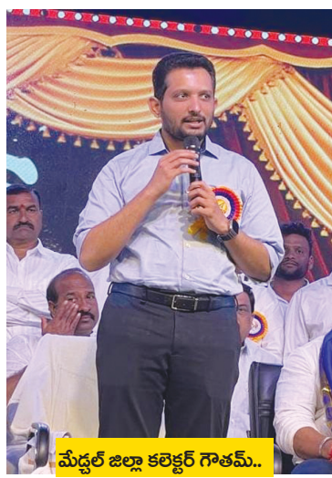
మేడ్చల్ జిల్లా కలెక్టర్ గాతమ్..