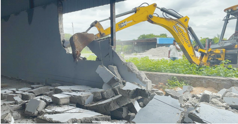
బొరంపేట్లో శిఖర పాఠశాల సమీపంలో, నాలుగు అక్రమ షెడ్లు కూల్చివేసిన..ఫైల్ ఫోటో..